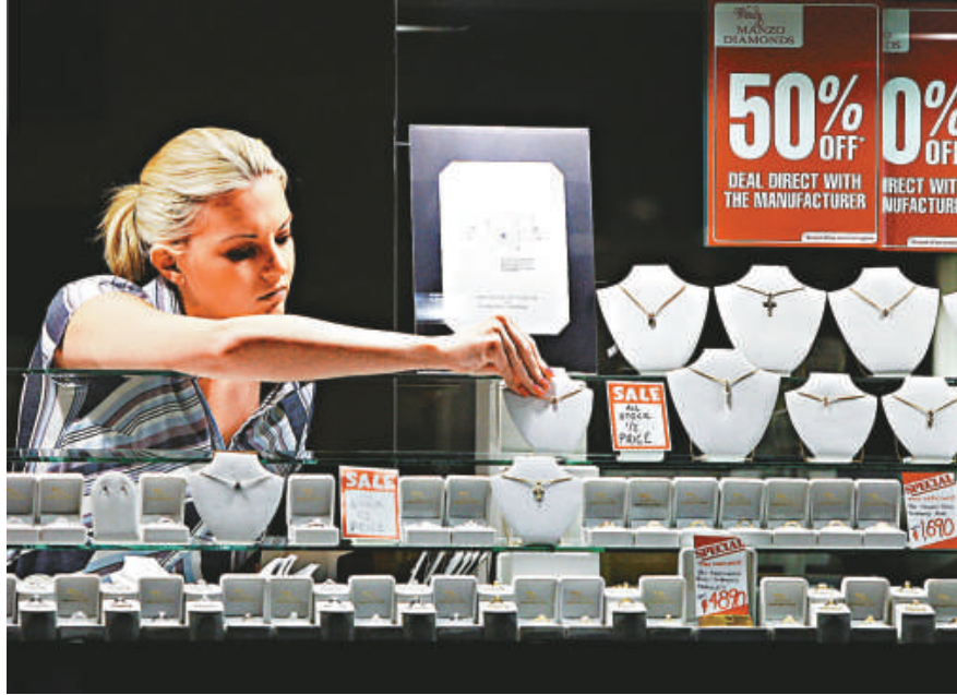
悉尼市的珠寶店五折吸客

澳洲經濟出乎意料收縮，澳元兌美元應聲跌至 1 個月低位，澳元一度跌至 62.86 美仙，是 2 月 3 日來最低水平。澳元兌日圓跌 0.8% 至 62.28 日圓。匯市交易員預測，下周澳元料跌至 62 美仙低位。紐元跟隨澳元下跌 0.7% 至 49.50 美仙。