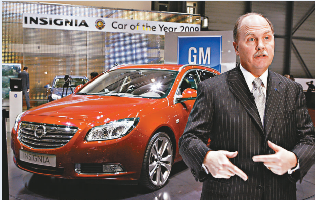
通用汽車營運總監亨德森

日本三大車廠本田、日產和萬事得在周三亦表示，面對全球經濟跌勢加速的影響，它們或會向政府尋求危機貸款。外電報道，豐田汽車的財務部已向政府申請援助，但其他三大車廠並未有講明將會申請多少援助。