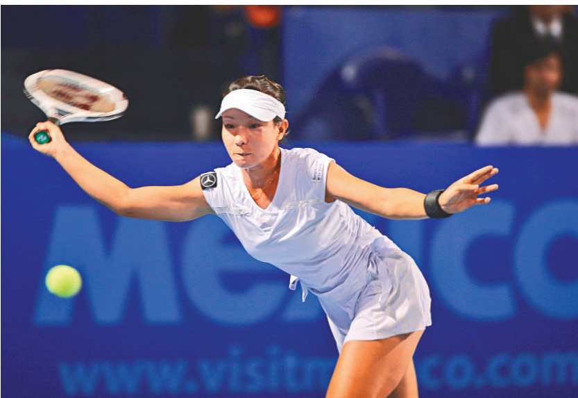
►鄭潔戰勝匈牙利選手晉 8 強

綜合外電墨西哥·蒙特雷四日消息：兩位「中國金花」鄭潔和李娜，在墨西哥蒙特雷女子網球公開賽次圈賽事順利過關。4 號種子鄭潔以 6：3、6：4 擊敗匈牙利施妮克，李娜亦同樣以 6：3、6：4 打敗捷克施高美絲卡而晉級 8 強。7 號種子阿根廷迪高亦以直落兩盤 6：2、6：4 淘汰烏克蘭歌妮特舒娃。