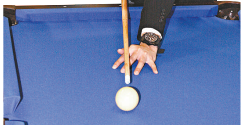
▼傅家俊的世界排名升至第五

陶菲克同時表示希望印尼年輕選手能夠超越他，甚至取代他參加倫敦奧運會。他說：「我覺得年輕選手應該取代我的位置，去打倫敦奧運會。因為 2012 年我已經 32 歲了，如果那時他們還沒法擊敗我，那說明印尼羽毛球運動水準出現了問題。」