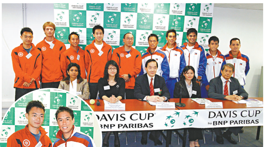
▲兩隊成員一起出席抽籤儀式

延期後的賽程與足總最初編定的日期相同。此前，南華為了有更充裕時間備戰下周二對印尼 PSMS 棉蘭的亞協杯賽事，提出改期並獲足總接納，豈料昨午的一場雨令南華的備戰大計受到影響。已定於周日兵發泰國出戰亞協杯的東方，也無可避免地要在下周一啓程，如此一來 2 隊球員在亞協杯首戰的狀態將大打折扣。