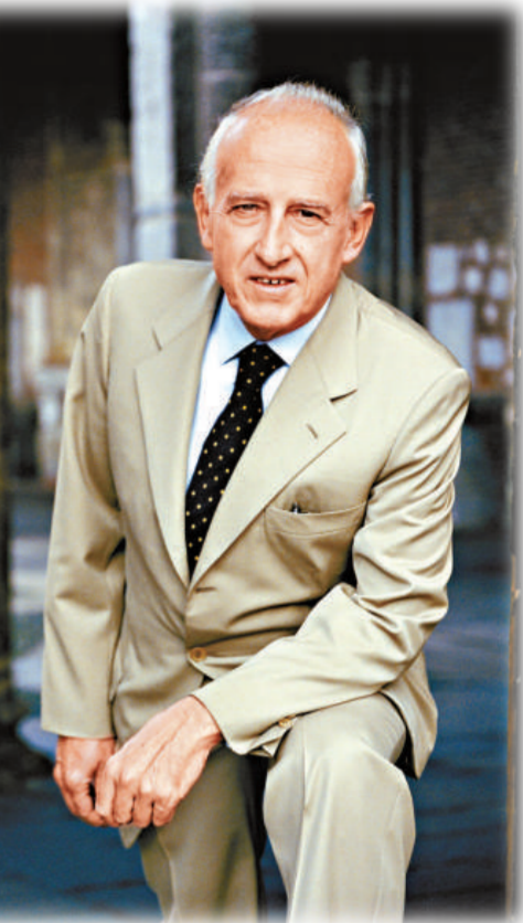
▲當代鋼琴大師波里尼 ▲波里尼首度訪港，在港只演奏一場