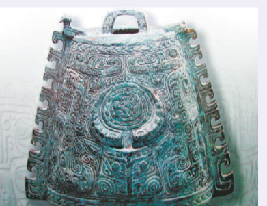
▲精美江西商代青銅器，器類全，造型奇巧，鑄造精美。如獸面紋柱足青銅鼎、圓渦紋柱足青銅鼎、獸面紋虎耳扁形虎足青銅鼎等等，均是絕世之作。展覽展期至五月三十一日。

新幹大洋洲商代大墓位於江西省新幹縣大洋洲鄉程家村，一九八九年進行了考古發掘，是繼河南安陽殷墟、四川廣漢三星堆之後，商代青銅器的又一重大發現。此次展覽展出了江西商代青銅器二十九件，有鼎、鬲、甗、簋、豆、壺、甬、壺、瓚等，涵蓋了大洋洲所出土青銅禮器的全部類型，品種多