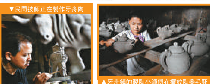
▲民間技師正在製作牙舟陶 ▲牙舟鎮的製陶小師傅在擺放陶器毛胚