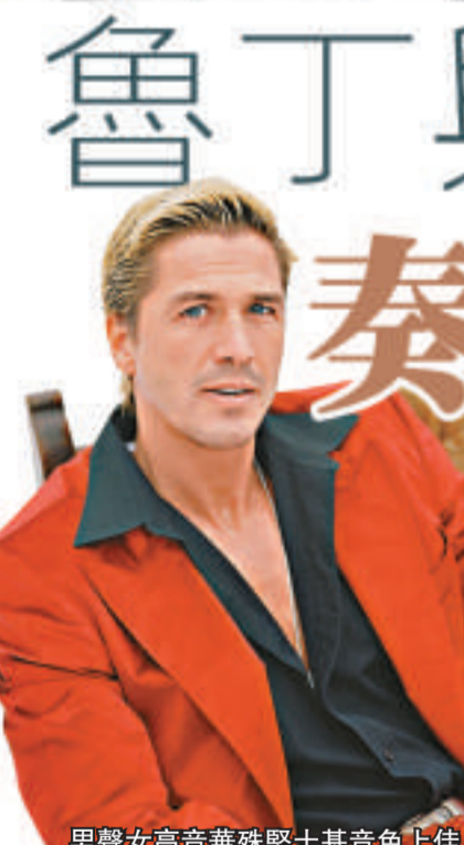
男聲女高音華殊堅士基音上佳

香港城市室樂團自去年九月邀得法國指揮家托勞擔任首席指揮後，氣象頗為一新，比以往更上層樓。在托勞領導下，樂團自去年九月的「豎琴天后」，至今年一月的「天籟之聲」及二月的「李昂演奏蕭邦」的幾場音樂會，都有不俗的表現，因而贏得觀眾及樂評界的不斷讚賞。事實上，綜觀近期幾場音樂會，上座率亦十分理想。這個情況實在叫人欣慰。