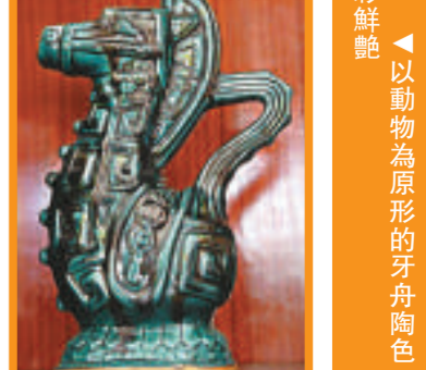
▲以動物為原形的牙舟陶色