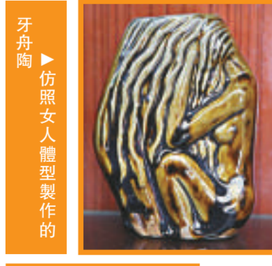
▲仿照女人體型製作的牙舟陶

牙舟陶器造型自然，多為生活用具及陳設品，動物玩具和祭祀器皿，其特點是造型自然古樸，線條簡潔明快，色調淡雅和諧，具有濃重的出土文物神韻。陶器多取材於當地少數民族的服飾和器皿，因此民族特色濃厚，實用價值高，既是生活用品又有工藝價值。色調有白、翠綠、醬紅、天藍、古銅、鴨黃等；牙舟陶在設計上選擇蠟染、刺繡、桃花圖案，以浮雕的手法體現，富有裝飾性。由於加強了工藝設計能力，現在牙舟陶的產品既保留了我國古代陶器造型的優點，又從少數民族的日用品上吸取了營養，製造雙魚罐、孔雀插屏以及有濃厚的民族風味和實用價值的瓶、碗、筆筒、檯燈、壺、盤等。牙舟陶的許多精美之作曾被選送日本、朝鮮、丹麥、芬蘭等國展出。遠銷美國、英國、法國、加拿大、澳洲、馬來西亞等十多個國家。「牙舟陶器燒製技藝」已列入第二批國家級非物質文化遺產名錄。本報記者 杜錦霞