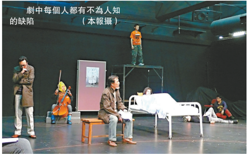
劇中每個人都有不為人知的缺陷

香港話劇團之《美麗連繫》，將於三月十四日至三十日在香港文化中心劇場演出。門票現於各城市電腦售票處發售。