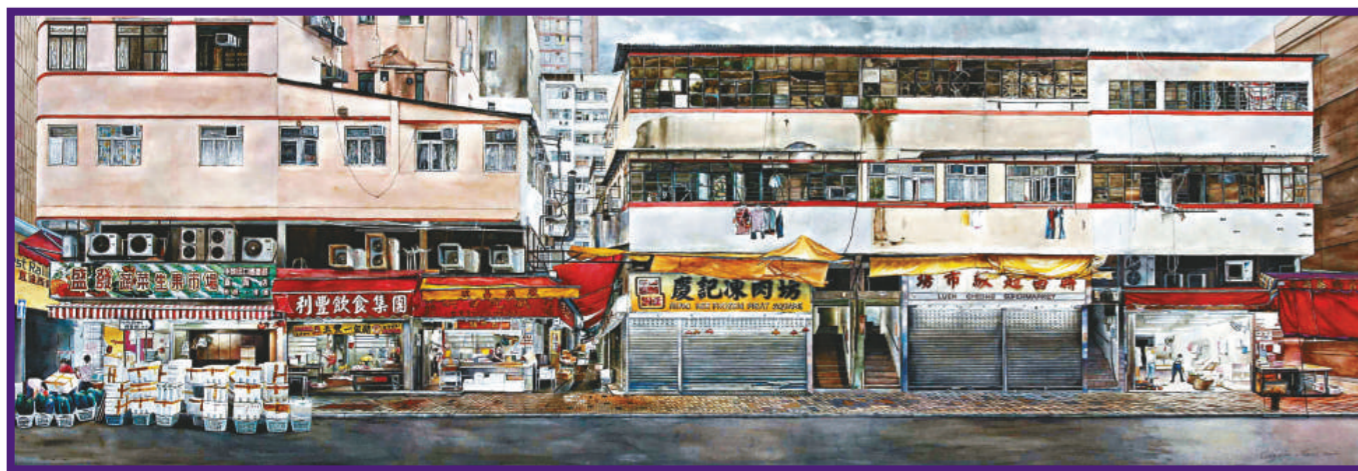
▲在《九月的清晨》中的景象，是梁潤湛經過藝術整理，才有如此簡潔乾淨

展覽：梁潤湛水彩畫展——香港組曲：舊區、老舖 地點：上環文娛中心六樓展覽廳 展期：即日起至三月二十六日 時間：早上九時至晚上八時