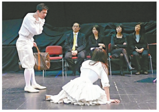
話劇團演員示範演出劇中廣播劇情節的片段

創作今次演出的動機。他說：「《美麗連繫》想說的是，只要人開始認為世界是一個整體，感應身邊周圍的人與事，人的處事態度不同，真正的改變會自然發生。」