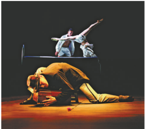
從戶內到戶外，黎海寧的作品賦予新動感

【本報訊】城市當代舞蹈團（CCDC）為慶祝成立三十周年，將於三月七及八日下午二時半及四時半在香港文化中心露天廣場呈獻四場黎海寧戶外舞蹈劇場《K情城市》，結集香港著名編舞家黎海寧的代表作選段，這是今年香港藝術節唯一免費入場的節目，期望讓更多市民接觸現代舞。