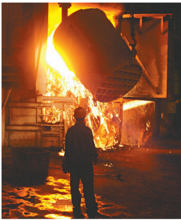
河北是中國第一產鋼大省，圖為邯鄲武安的鋼鐵生產線

未來黃驊港將被建成功能綜合港口，水電路訊等基礎設施也將得到高標準的規劃建設。再加上渤海新區土地資源的整合開發，冀中南地區的臨港產業將得到大發展。