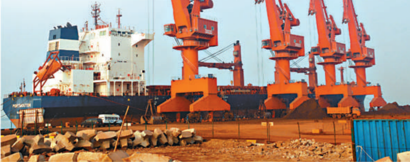
曹妃甸將成為冀東經濟區的出海口，圖為建設中的曹妃甸

吳良輔同時指出，「我們的研究還只是一項自上而下推動建立區域協調機制、推動科學決策、民主決策的民間努力。我們的想法是，通過學術上的共識推進社會共識，進而達到決策共識。」