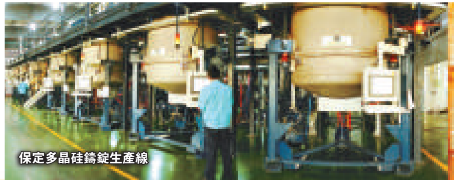
保定多晶硅鑄錠生產線

在實現通公交通、通「010」電話、通電力、通有線電視的基礎上，涿州建設了京白連接線、涿密高速、張涿高速和京石客運專線，啟動了一批城區路網工程，以設施對接促進生產要素加快流動。