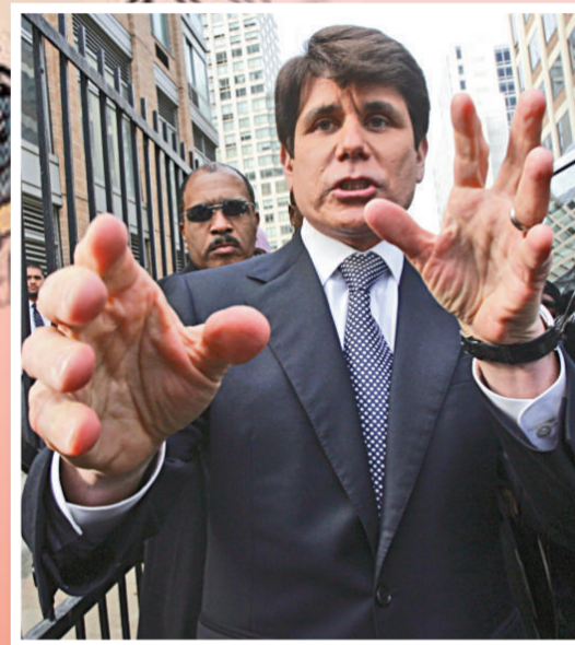
▲「賣官州長」布拉戈耶維奇

奧巴馬能改變華盛頓，整頓他所謂的「出了毛病的制度」？或是他被華盛頓改變？我們拭目以待。