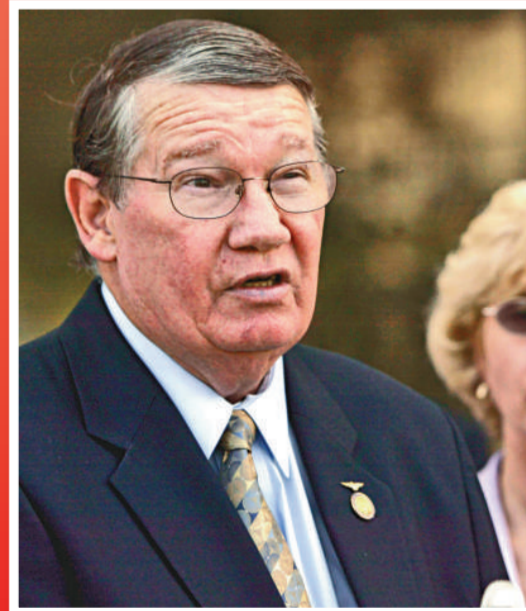
▲美國前共和黨眾議員蘭迪·卡寧漢姆（左）承認犯有收取賄賂和逃稅兩項罪行