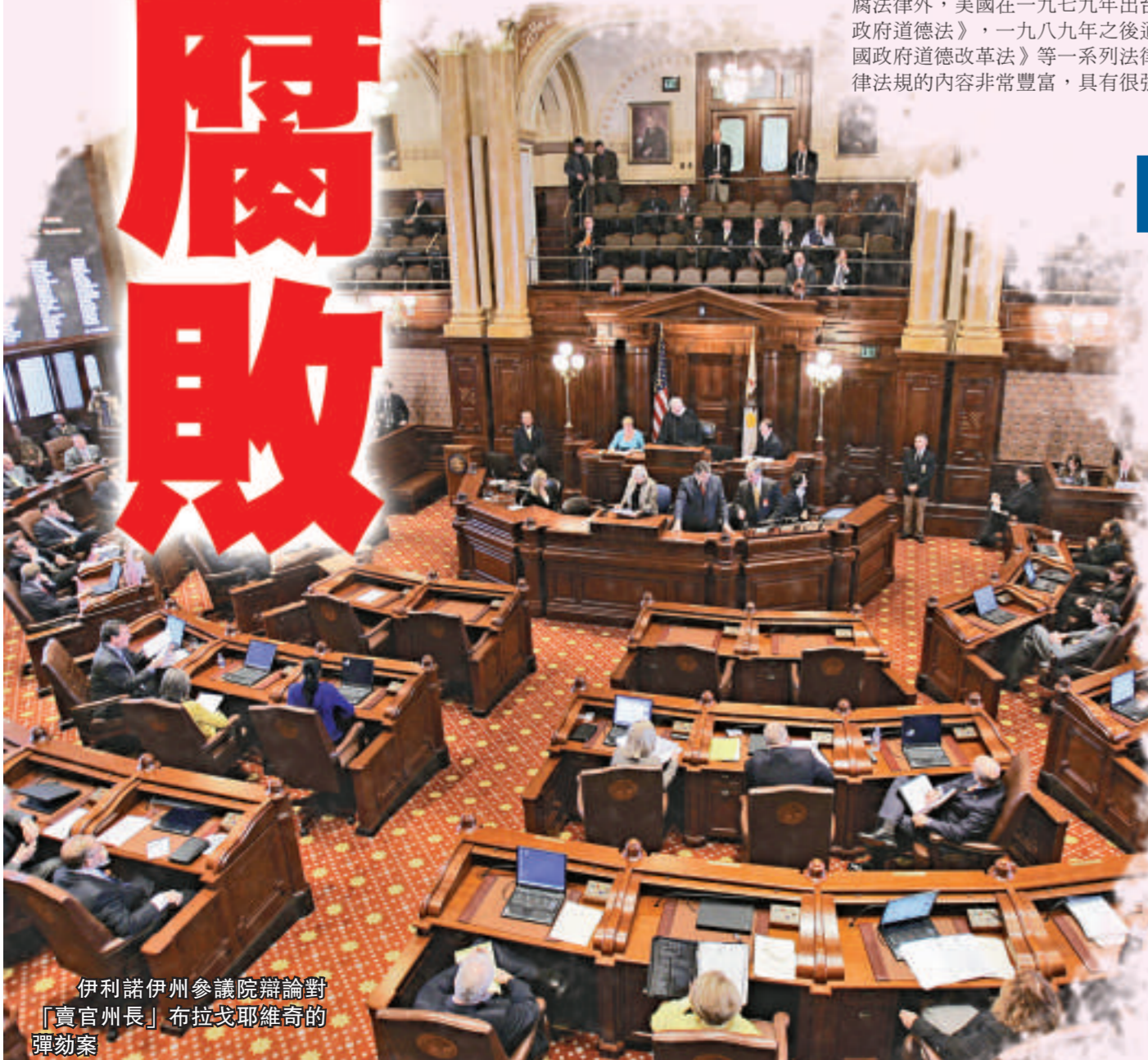
伊利諾伊州參議院辯論對「賣官州長」布拉戈耶維奇的彈劾案

在國會任職十五年之久的美國前共和黨眾議員蘭迪·卡寧漢姆於二〇〇五年十一月承認犯有收取賄賂和逃稅兩項罪行，並引咎辭職。這位曾在越戰中表現出來的老兵承認，在二〇〇一至二〇〇四年擔任眾議院撥款委員會成員期間，多次利用職務之便暗箱操作高達數千萬美元的國防採購項目，並藉此從採購商處索取現金、支票以及禮物，折合金額共計二百四十萬美元。此外，他還數次虛報納稅申報表，其中涉及至少一百萬美元的不明收入。二〇〇六年三月，美國加州地方法院判處卡寧漢姆八年零四個月監禁，同時裁決沒收其價值一百八十五萬美元的受賄物品，並要求其支付一百八十萬美元的逃稅款。卡寧漢姆受賄案是美國國會歷史上少見的大案，而他本人也成為四十年來被判入獄時間最長的前國會議員。