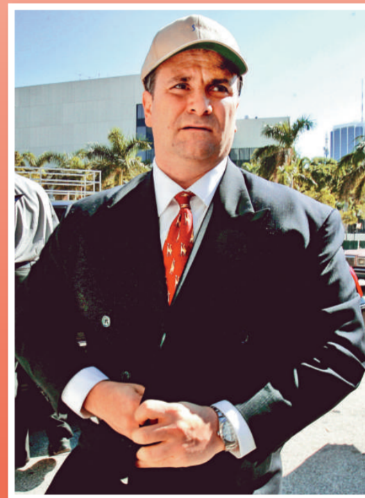
▲美國游說業「教父」阿布拉莫夫