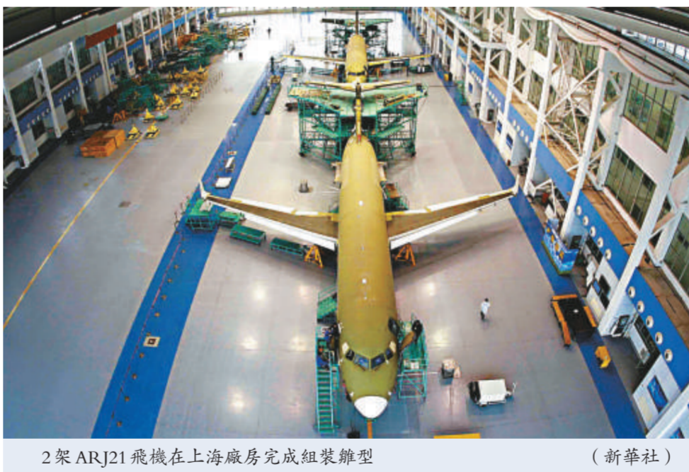
2架ARJ21飛機在上海廠房完成組裝總型

中國商飛方面指出，今年將是ARJ21項目實施以來任務最重、壓力最大、影響最深的一年。去年成功首飛的首架ARJ21-700飛機要完成第一階段研製試飛任務、轉場西安關良完成研製和取證試飛，以盡快取得中國民航局適航證；正在進行總裝的第2、3架飛機不僅要完成總裝和相關機上試驗、實現首飛，亦需轉場完成研製和取證試飛；正