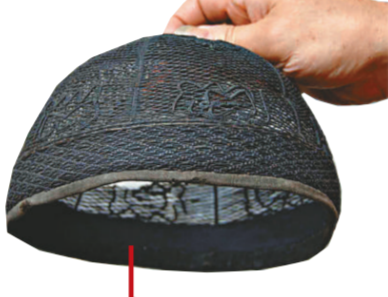
用馬尾毛編織的古老帽子