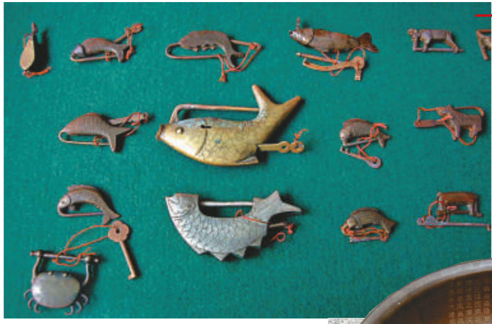
大鎖和小鎖 動物造型鎖