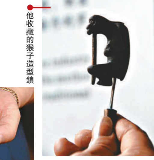
他收藏的猴子造型鎖