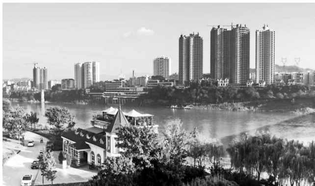
合川城區綠樹掩映，美不勝收