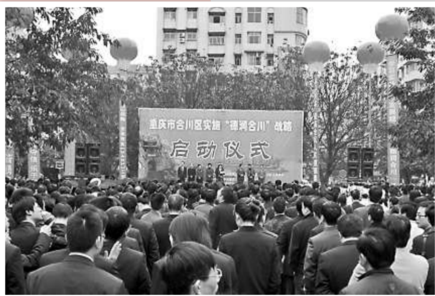
合川全面實施「德潤合川」戰略，建設新時代的重慶人文道德高地