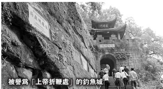
被譽為「上帝折鞭處」的釣魚城