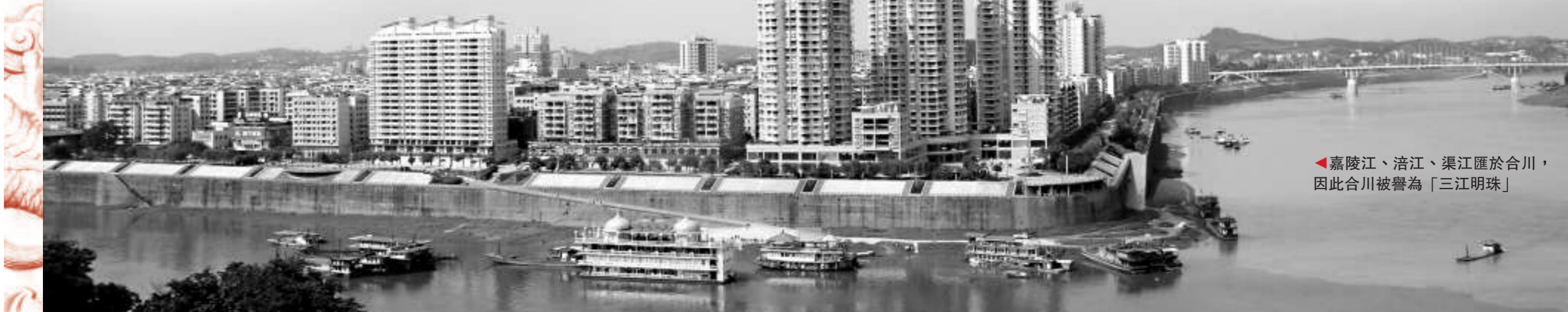
嘉陵江、涪江、渠江匯於合川，因此合川被譽為「三江明珠」