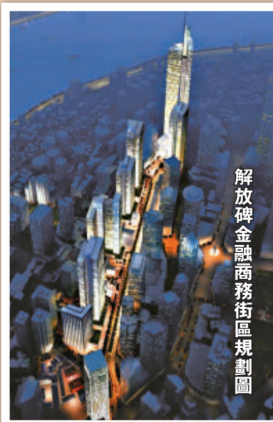
解放碑金融商務街區規劃圖