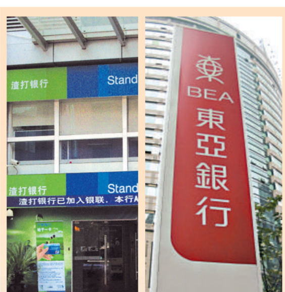
渣打銀行 東亞銀行