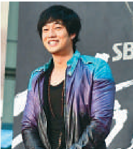
▲蘇志燮原來是「少女時代」的偶像

她們更說，最近迷上了趙寅成和蘇志燮。秀英更透露，當她們出席百想藝術大賞頒獎禮時，一聽到蘇志燮的名字，即時尖叫起來，心情興奮。