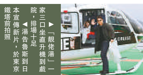
►「靚佬湯」一家三口坐直升機到戲院，排場十足 ▲湯告魯斯到日本宣傳新片，於東京鐵塔前拍照

他們在成田機場下機後，直接乘坐直升機到戲院，排場十足。湯告魯斯一行在位於赤坂剛興建完成、預定四月才啓用的直升機場降落，成為第一批使用的乘客。「靚佬湯」心情極佳，笑言坐直升機十分舒服。