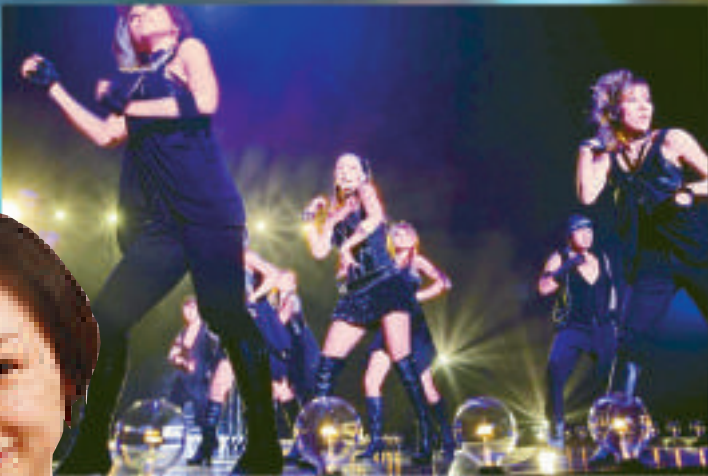
►安室今次巡迴動員四十五萬歌迷，創下女歌手的紀錄 ▲安室（中）於橫濱開騷，唱足三十首歌