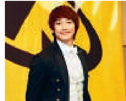
►Rain官位總身，豁達面對

Rain當年因取消演出，而被當地娛樂公司Click告上法庭，並向Rain及他的前經理人公司JYP Entertainment索償四千萬美元。