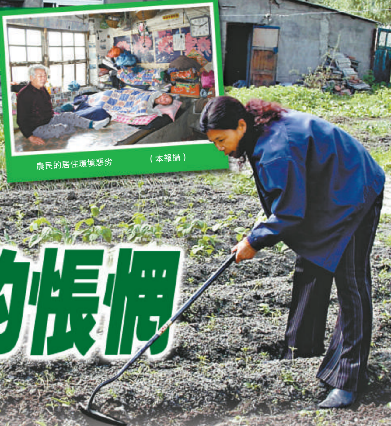
農民的居住環境惡劣