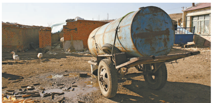
喝不上自來水村民只能用此類鐵罐存水

近年農業發展取得了明顯成就。但耕地持續減少、淡水資源短缺、金融和科技支持不足、道路水利設施老化失修等問題對農業穩定發展的制約日益凸顯，農業仍然是整個國民經濟中最薄弱的環節。路修通後，莫字村的農產品賣上了好價錢，大孤鎮的水稻中外馳名；眼下，窪中高村民正期盼着早日接通腳下的這條斷路。