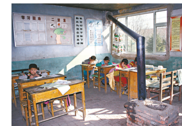
「村小」每個班級的人數都很少

如今在農村，沒能完成九年制義務教育的孩子並不佔少數。鎮上一所中學，三年前入學新生有80多人，能參加去年中考的只剩下20多人。這不過是記者隨意調查的一處，輟學情況比這裡更嚴重的學校還有很多。