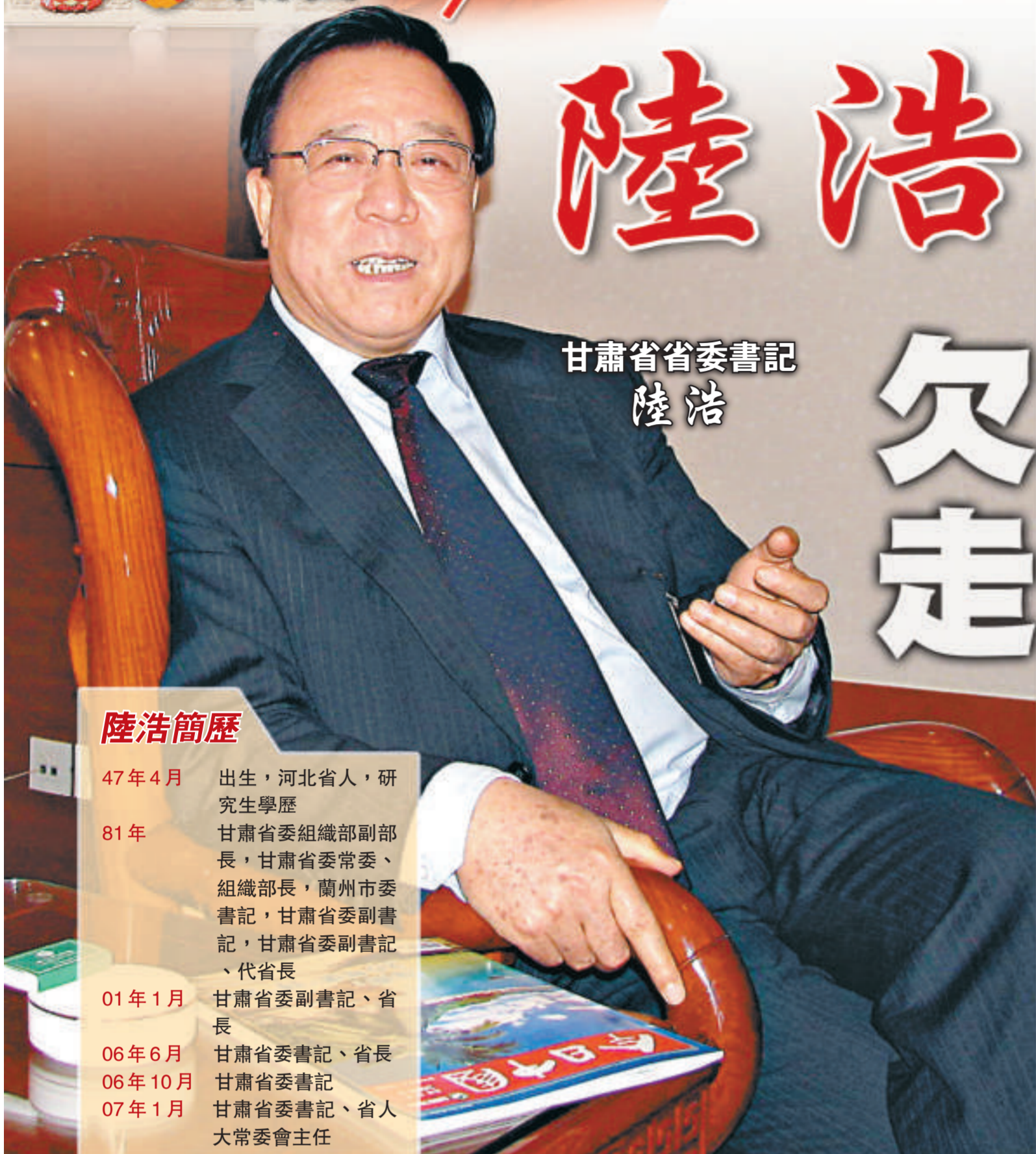
甘肅省省委書記 陸浩