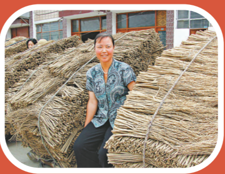
農婦已成甘肅文峰中藥材集散市場上的大藥材商

2008年10月26日至11月1日，甘肅省黨政代表團到新疆的烏魯木齊、和田、喀什、石河子、伊犁等市州進行實地考察，詳細了解了工業園區、開發區、基礎設施、陸地口岸建設及特色產業發展、宗教管理等方面的情況，並同新疆自治區政府簽署《全面戰略合作框架協議》、《煤炭供運運輸保障合作協議》。