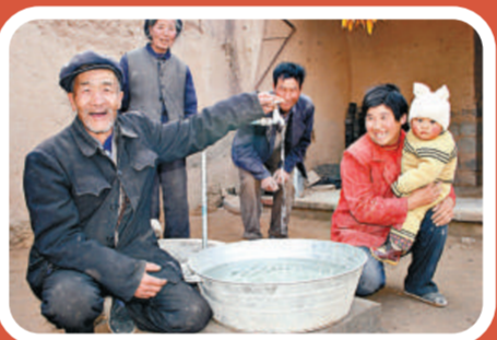
甘肅安全飲水工程使自來水接進了臨夏回族自治州積石山縣的山村農戶家

他很嚴肅地說，首先，在全國競相發展的態勢下，我們同發達地區差距繼續拉大，協調各方面利益的難度更大，這將是個長期的壓力。其次，我省基礎設施薄弱的狀況短期內難以根本改變，吸引外資的能力弱，投資渠道單一，資本短缺的問題仍然是制約經濟發展的突出矛盾。同時，農業基礎脆弱，農民增收難度大，始終是制約又好又快發展的重要因素。另外，產業結構單一，資源環境壓力大，轉變發展方式的難度大。社會事業發展滯後，勞動者素質不高，自主創新能力弱，發展的內在活力依然不足。這些都是制約發展的嚴重「瓶頸」。但是這些問題的根本解決還是要以發展來支撐。