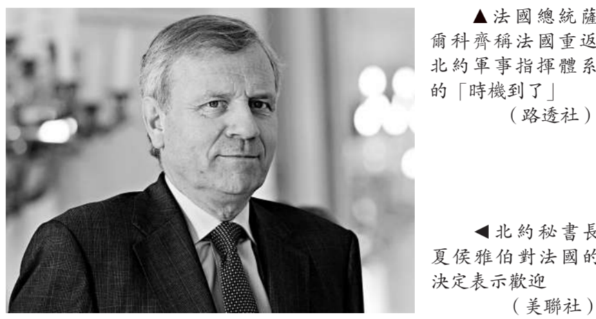
▲法國總統薩科齊稱法國重返北約軍事指揮體系的「時機到了」