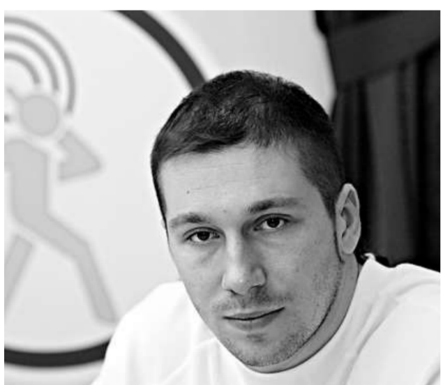
被俄羅斯全球通緝的希什瓦爾金 (資料圖片)