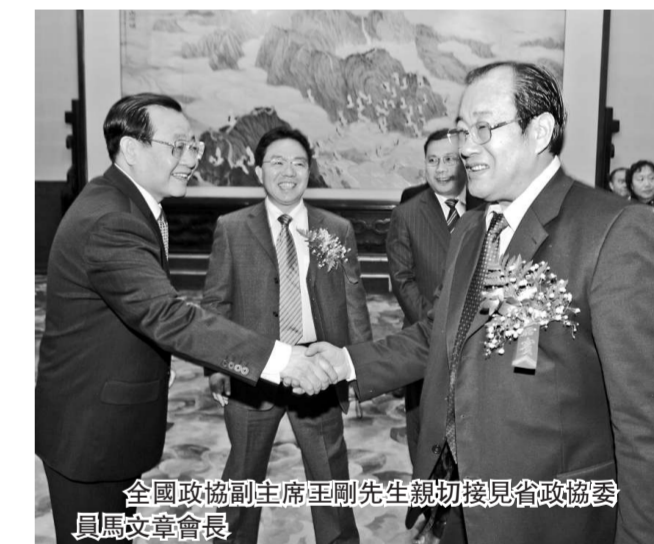
全國政協副主席王剛先生親切接見省政協委員馬文章會長

2007年11月26日，由河南省傳統文化促進會主辦策劃，河南省委宣傳部、統戰部指導和主辦，省文化廳、民政廳、民進河南省委、河南省傳統文化促進會主辦的「根之情」、「唱響中原」、「好個大中原」系列活動在河南人民大會堂舉行開幕式，省政協主席王全書、省人大副主任、副省長、省委宣傳部部長孔玉芳、省人大袁祖亮副主任、省文化廳廳長、省民政廳廳長等領導和嘉賓五百餘人出席。馬文章在開幕式上致辭：我們這次活動的指導思想是努力宣傳黨的十七大精神，樹立科學發展觀，挖掘中原厚重的文化底蘊，昌盛河南博大精深的傳統文化，頌揚古老而