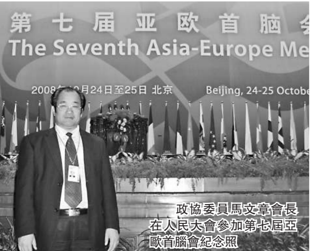
政協委員馬文章會長在人民大會堂參加第七屆亞歐首腦會紀念照