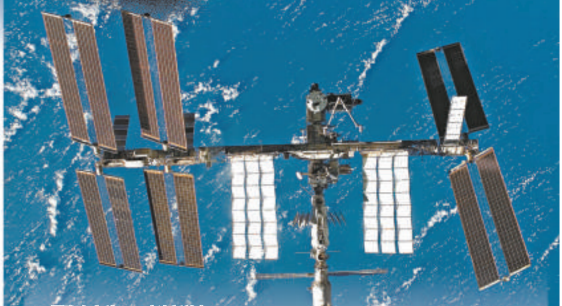
國際太空站

地球軌道上有數以萬計的太空垃圾，諸如失效的衛星、宇航員遺落的攝影機，甚至是一片脫落的漆片。不久前俄羅斯一顆報廢的衛星在太空撞毀了一顆美國通訊衛星。美國太空總署說，碎片撞擊空間站的可能性雖然極小，但還是得多小心，盡可能地注意太空垃圾的位置在哪裡。