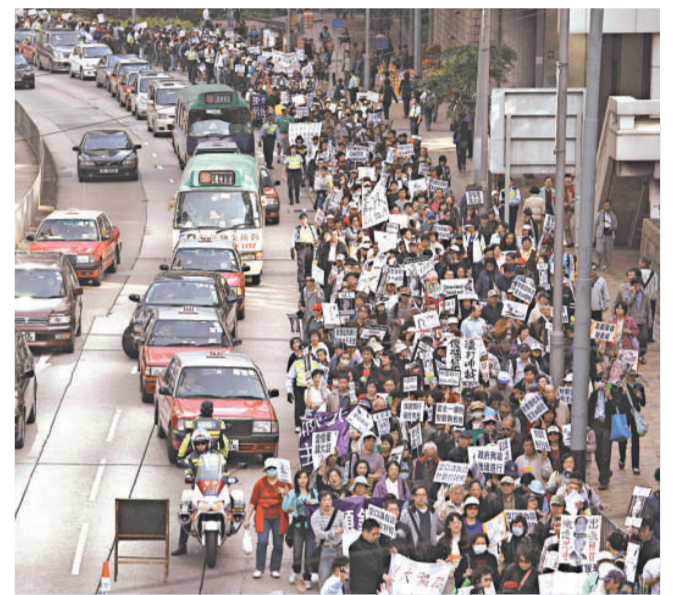
逾千名購買雷曼相關產品投資者昨舉行遊行，不滿政府處理雷曼事件手法

部分遊行人士手持行政長官曾蔭權、財政司司長曾俊華和金管局總裁任志剛的照片，批評他們並沒有幫助受影響的投資者，亦有人手持不同銀行名字的紙牌，批評他們的銷售手法有欺騙成分。