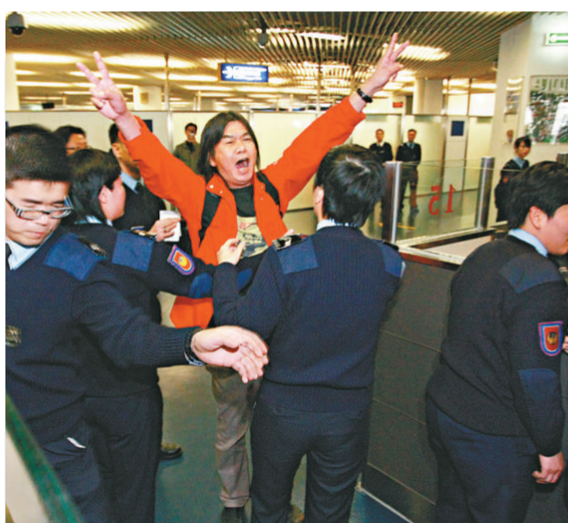
反對派議員在澳門海關擾亂秩序

【本報訊】反對派昨日大張旗鼓到澳門「闖關」，結果在澳入境大堂擾攘一番後，三十人獲准入境，五人被拒。對於拒絕五人入境，澳門政府表明，是據《保安綱要法》拒絕有關人士入澳的，以維護社會穩定。港府發言人表示，已經向澳門當局了解並表達對事件的關注，並會注意事態發展。而進入澳門的反對派成員，在當地交流及午膳後，陸續回港。