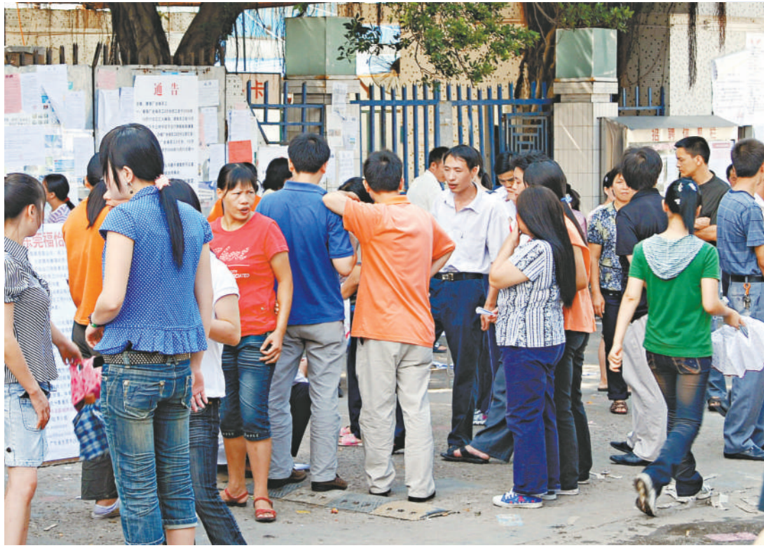
近年人民法院受理的涉港澳民商事案件數量逐年增多

司法解釋規定，受送達人在內地設有代表機構的，人民法院可以直接向該代表機構送達。受送達人在內地設有分支機構或者業務代辦人並授權其接受送達的，人民法院可以直接向該分支機構或者業務代辦人送達。