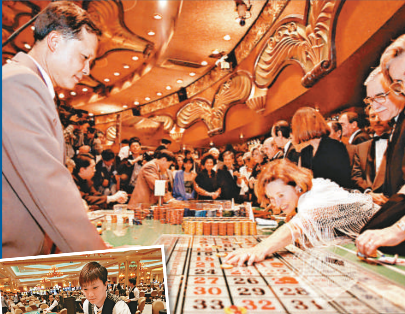
▲馬政府加速發展博弈業，台灣最快在二零一三年開賭場。圖為澳門賭場。(資料圖片)

遊行隊伍到景福門時，特別以倒著走的方式遊行前往「總統府」前廣場，並在台北賓館前演出「推翻賭博共和國」行動劇，劇情是開設賭場，乍看經濟蓬勃發展，卻有許多產業倒閉，時有抗議暴力、貧富不均、犯罪發生，賭國國王也被抗議人士丟骰子砸死，賭國終告結束。