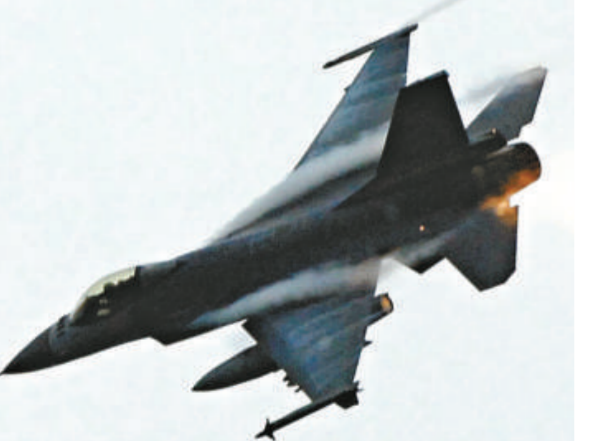
外傳台灣將再向美國購買武器。圖為台灣向美國購買的F16戰機。(資料圖片)

不過，郭冠英十三日面對媒體訪問時，強調自己「根本不是范蘭欽，也不認識這個人」。他表示，沒有寫過台灣是「鬼島」的言論，對於被扯到這個事件中，相當詫異。