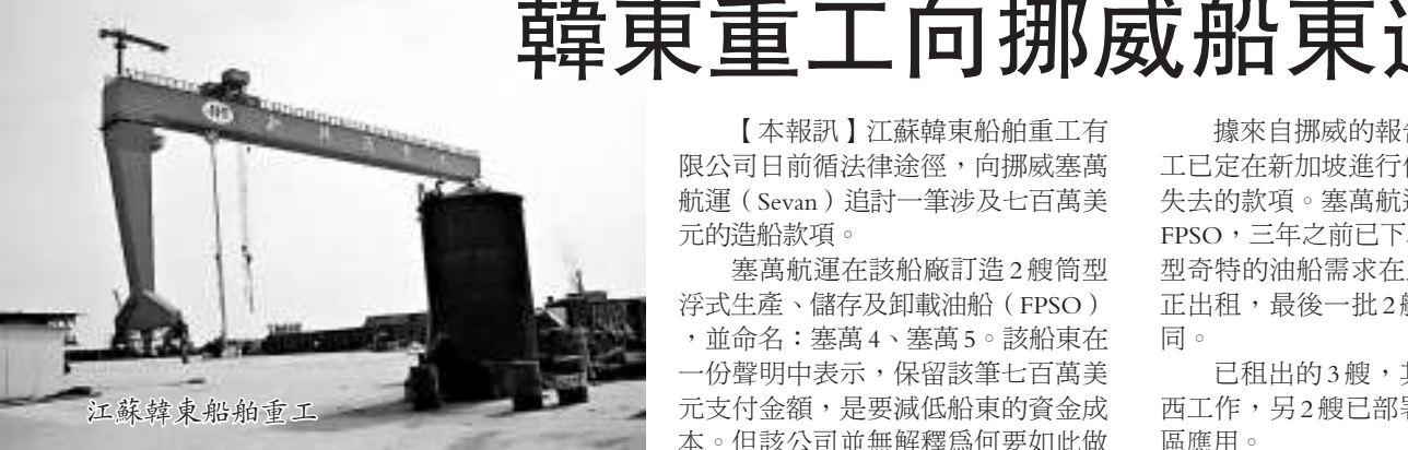
江蘇韓東船舶重工

【本報訊】江蘇韓東船舶重工有限公司日前循法律途徑，向挪威塞萬航運（Sevan）追討一筆涉及七百萬美元的造船款項。塞萬航運在該船廠訂造2艘筒型浮式生產、儲存及卸載油船（FPSO），並命名：塞萬4、塞萬5。該船東在一份聲明中表示，保留該筆七百萬美元支付金額，是要減低船東的資金成本。但該公司並無解釋為何要如此做，並表示正設法將該2艘在建造中的FPSO以租船合約方式租給租家。