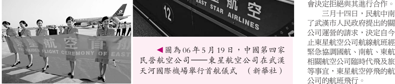
圖為06年5月19日，中國第四家民營航空公司——東星航空公司在武漢天河國際機場舉行首航儀式