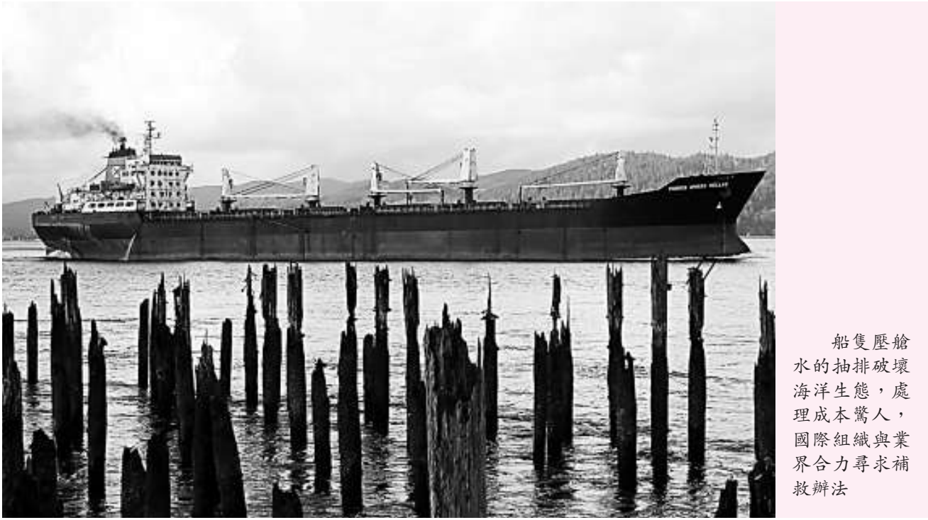
船隻壓艙水的抽排破壞海洋生態，處理成本驚人，國際組織與業界合力尋求補救辦法

壓艙水的抽排同時轉移有害物種，威脅全球海洋環境。IMO訂立「控制及管理船舶壓艙水與沉積物國際公約」，2004年獲16個會員國認可。不過根據該公約第18條，要在取得不少於30個國家的認可後1年，公約才會正式生效。海事環境保護委員會促請其他國家盡快同意公約。