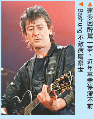
連莎因醉駕一事，近年事業停滯不前