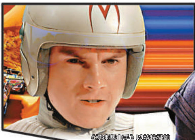
《極速賽車手》以特效稱帥