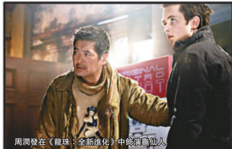
周潤發在《龍珠：全新進化》中飾演龜仙人