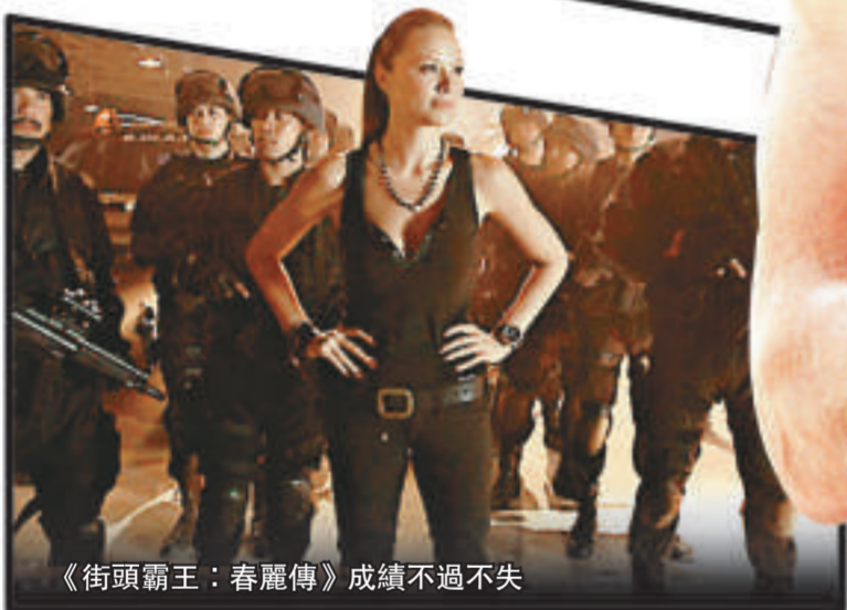
《街頭霸王：春麗傳》成績不過不失

《龍珠：全新進化》(Dragonball Evolution)的出現可說是見證了日本動畫(Anime)「進軍」荷里活二十多年來的收成期，同時亦開啓了繼年前J-Horror(日本恐怖片)被重拍之後的另一股「日潮」——將日本動畫重拍成真人電影在今明兩年將會陸續有來。