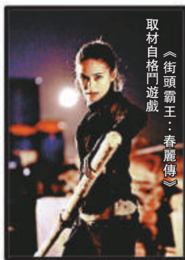
取材自格鬥遊戲《街頭霸王：春麗傳》