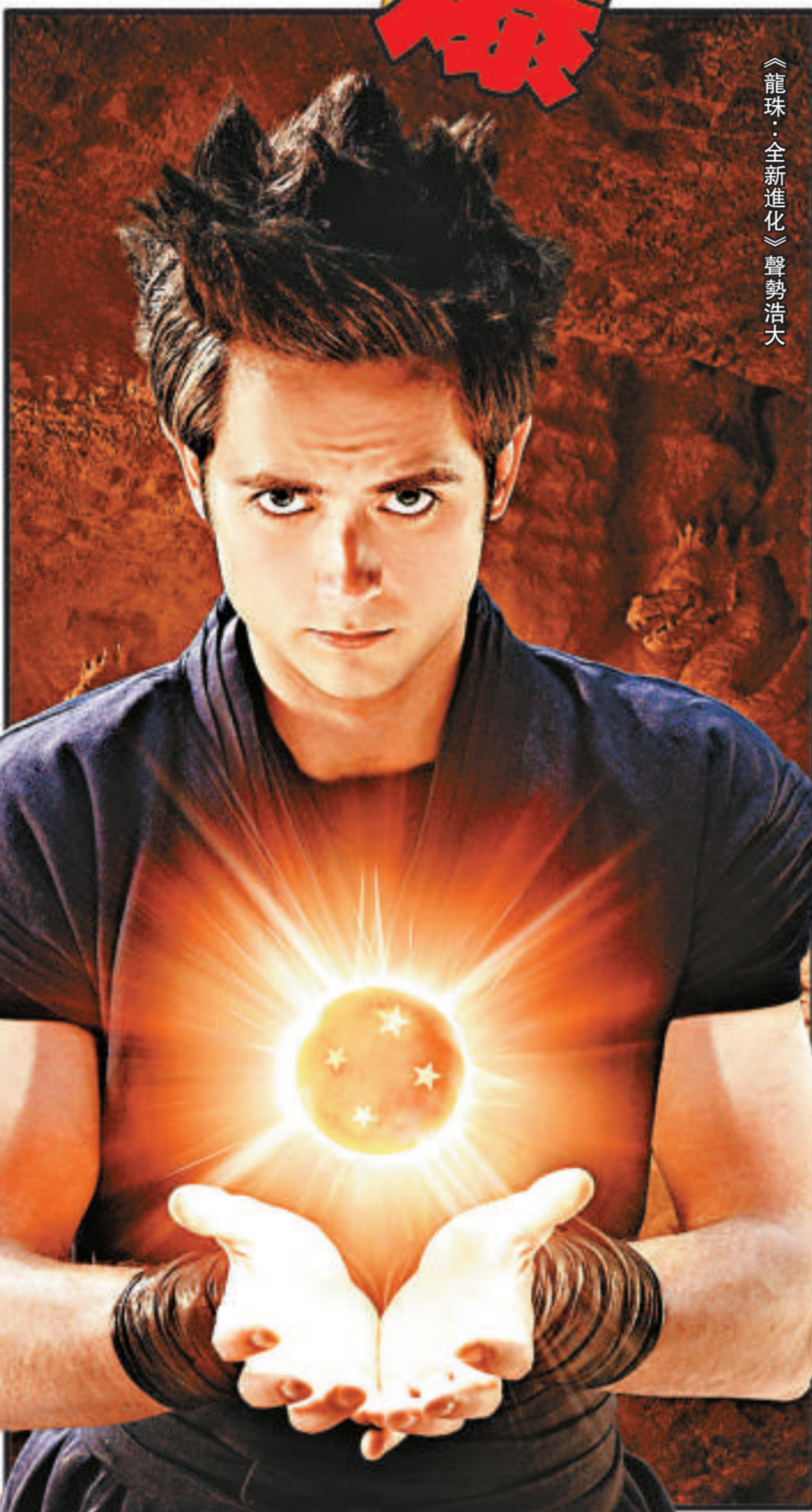
《龍珠：全新進化》聲勢浩大