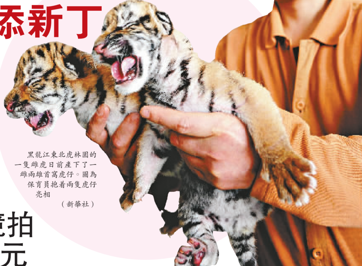
黑龍江東北虎林園的一隻雌虎日前產下了一窩兩雄兩雌虎仔。圖為保育員抱着兩隻虎仔亮相

東北虎是世界上體型最大的一種虎，分布在中國東北和俄羅斯的西伯利亞及遠東地區。1986 年，中國在黑龍江省建立了東北虎林園和橫道河子貓科動物繁育中心。這裡的東北虎已由最初的八隻種虎增加至目前的 800 多隻。