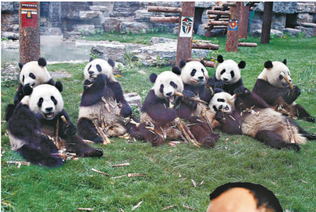
八隻赴京助威奧運的熊貓寶寶，將於本月 22 日下午返回家鄉四川。圖為八隻寶寶去年 6 月 2 日在北京動物園津津有味地啃着新鮮竹筍（資料圖片）

「所到每一個城市，市民們通過捐款、贈畫、寫詩詞等多種方式表達了對國寶大熊貓的關愛，並表示要以實際行動加入到保護國寶大熊貓的行列中來。」中國保護大熊貓研究中心的負責人對記者說。