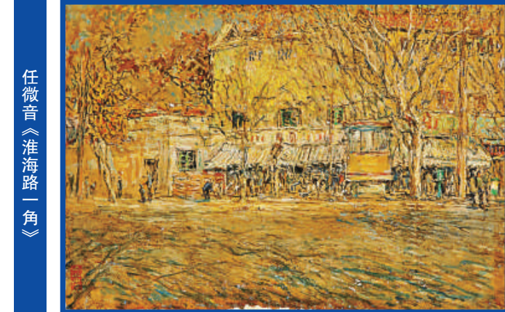
任微音《淮海路一角》