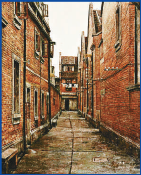
梁雲庭《上海弄堂》系列

義思潮在中國藝術領域高漲起來，改變了海派繪畫的文化品質和歷史際遇，極大地影響了此後中國畫壇的新格局。