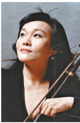
▲香港愛樂民樂團將舉行三場音樂會