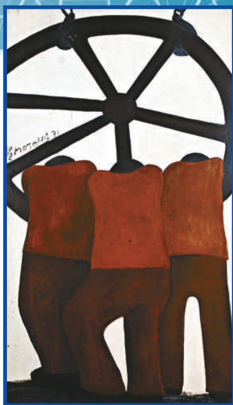
▲賀慕群《無題》 ▼朱祀瞻《寂寞山深處》