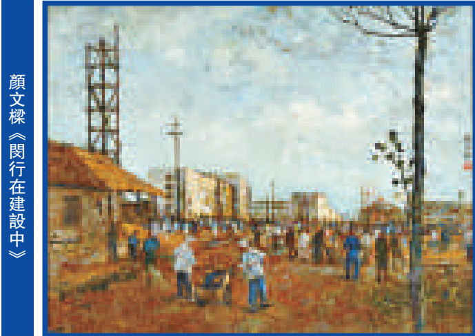
顏文樑《閘行在建設中》

十九世紀中葉以來，中國美術史上逐漸崛起一個被稱為海派或者海上畫派的畫家集群。它以上海為活動中心，吸納並引領着江、浙、皖乃至更大地區的藝術力量，其畫家陣容之浩大，繪畫風格之紛繁，以及得時代變革風氣之先的顯赫聲勢和深遠影響，均超過了此前的所有地方畫派。