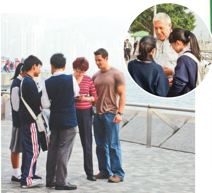
文理書院學生訪問外籍人士