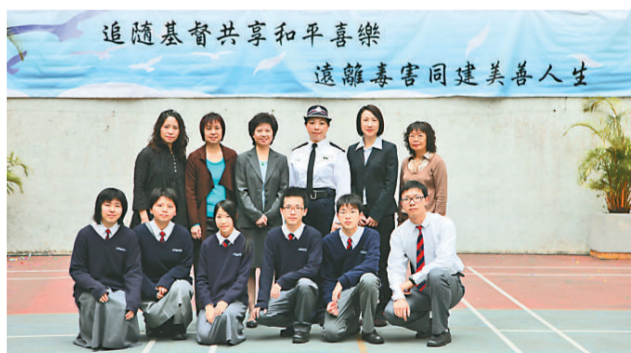
郭得勝中學舉辦健康教育周，向學生宣傳遠離毒害