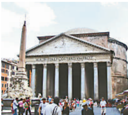
萬神殿是古羅馬時代宗教建築典範

萬神殿坐落於意大利首都羅馬的戰神廣場，始建於公元 27 年，其後於公元 80 年毀於大火，直至 125 年再由羅馬皇帝哈德良（Publius Aelius Hadrianus）下令重建，是現今保存最完整的羅馬帝國時期建築物，也是古羅馬時代的宗教建築典範。文藝復興時期的藝術家米開朗基羅讚嘆它是「天使的設計」。