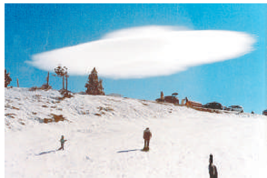
照片中的巨物並非UFO，而是由流到山頂上的潮濕空氣集結而成的莢狀高積雲，俗稱「飛碟雲」 (互聯網)

【本報訊】綜合英國媒體十九日報道：英國一名女子日前在西班牙一個山脈度假期間，看見一隻全白色的巨型「飛碟」赫然懸在半空，不過問問氣象學家，你便知道那其實只是俗稱「飛碟雲」的莢狀高積雲，UFO迷又要失望多一次。