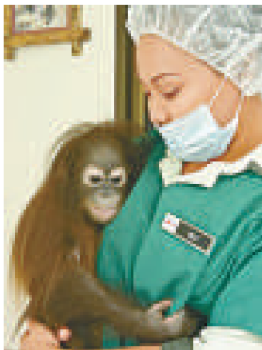
▲婆羅洲猩猩幼崽「四月」得到醫護人員的悉心照顧

小猩猩恢復健康後將會被放回野外，不再怎麼接觸人類，因此牠們滿一歲後會被送往「幼兒發展部」，接受野外生存技能訓練。低出生率和棲息地受破壞，導致婆羅洲猩猩的數目逐漸減少，目前只餘下四萬五千至七萬隻，瀕臨絕種。