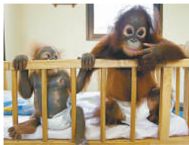
►「小六月」(左)與「四月」(右)在嬰兒床上