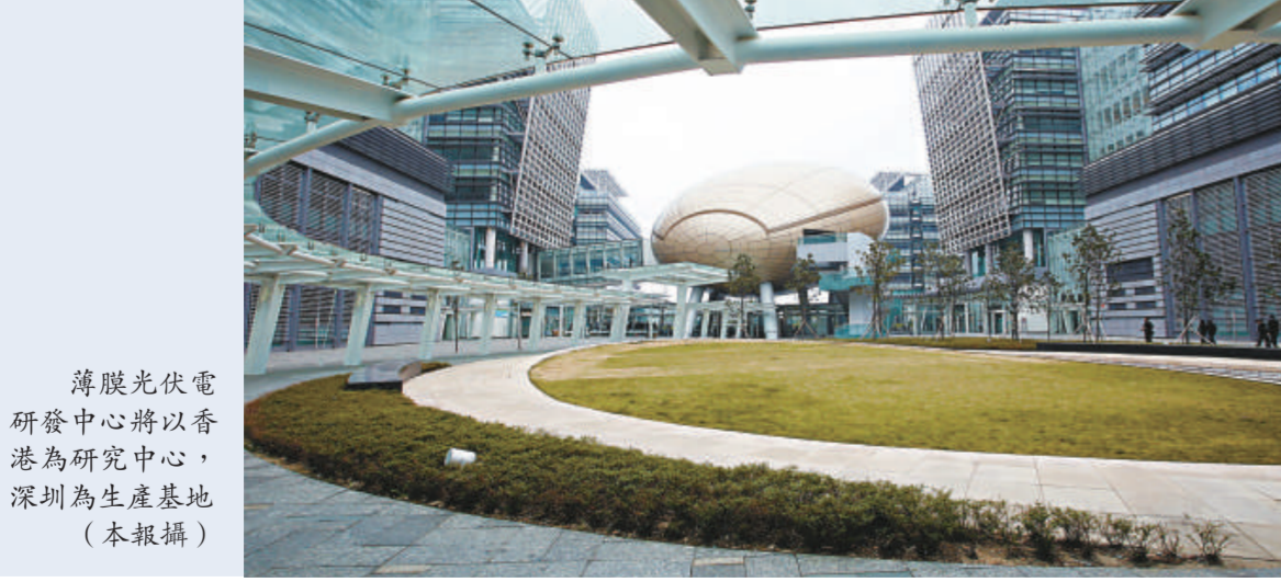
薄膜光伏電研發中心將以香港為研究中心，深圳為生產基地