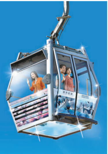
「水晶纜車」車廂底部為全透明玻璃，增加觀感刺激