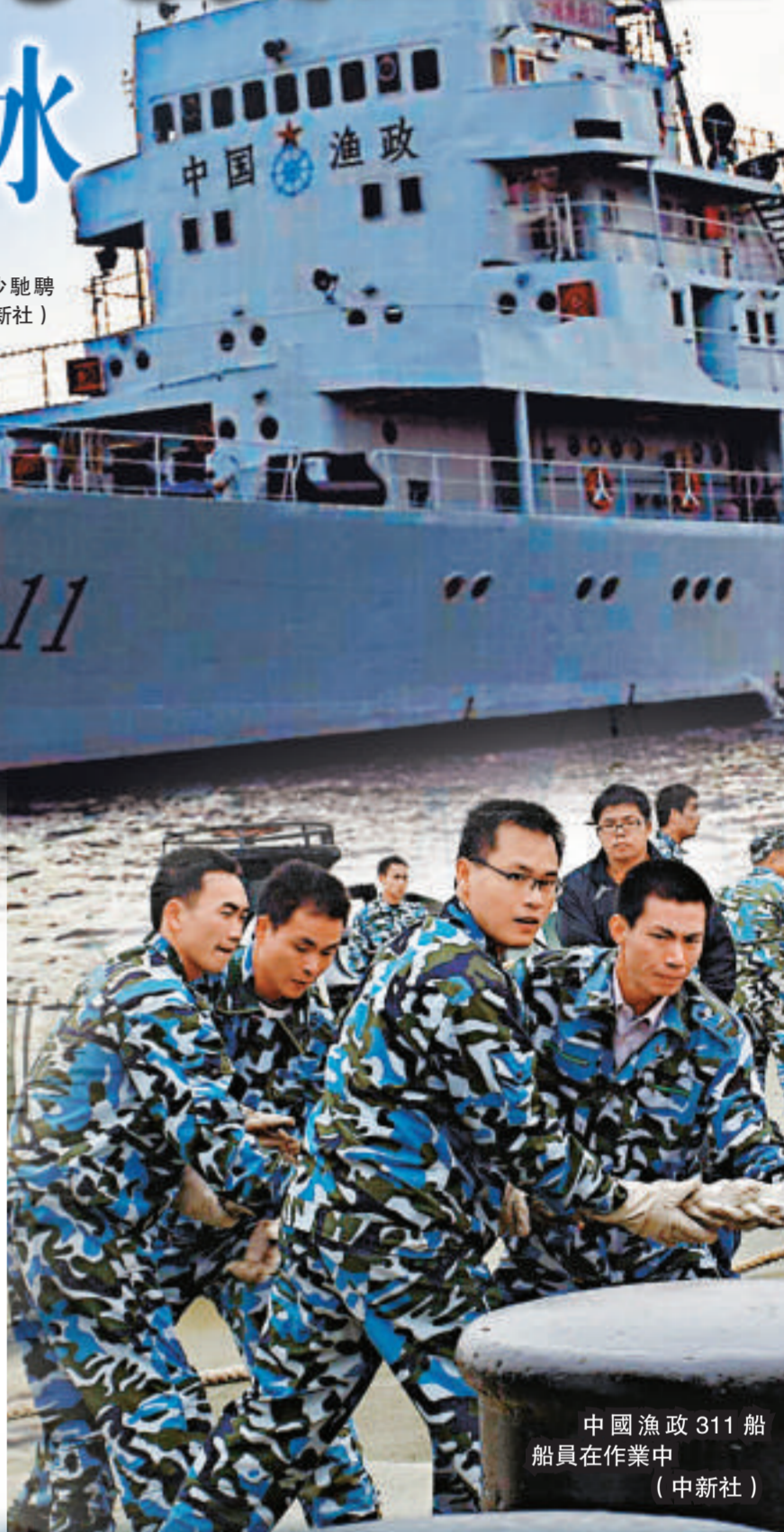
中國漁政311船員在作業中 (中新社)

中國漁政311船在西沙群島海域巡航執法中向《法制日報》透露，目前南海區漁政局已與有關部門正着手建立起西沙群島海域漁業資源的聯合監管機制，以打擊外籍漁船在西沙群島的侵漁行為，維護西沙群島海域正常的漁業生產秩序。