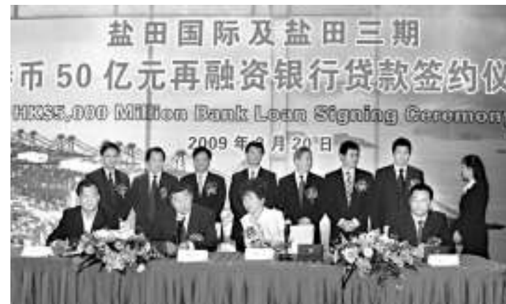
鹽田國際及鹽田三期 50億元再融資銀行貸款簽約儀 式 2009年3月20日

行。根據貸款協議，銀團將向借款人提供港元、美元及人民幣貸款合計港幣50億元，用於深圳市鹽田港區1、2期和3期集裝箱碼頭償還銀行貸款和建設、發展及日常營運支出。