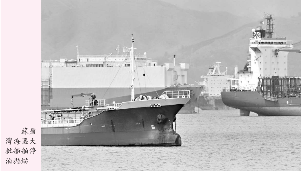
蘇碧 灣海區大 批船舶停 泊拋錨

另外，除了協議澇水船隻安排，羅克在會面後亦透露，日本期望將菲律賓港口視作折船港，但目前未有具體計劃。