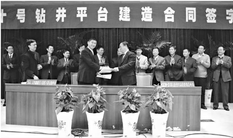
大連船舶重工海洋工程公司與中石化勝利石油管理局海洋鑽井公司簽協議

「勝利10號」鑽井平台作業水深50米，最大鑽井深度7000米，具備鑽井、固井和輔助試油等能力。平台總長75.21米、總寬53米、型深5.5米。該平台是勝利海洋鑽井公司第一次訂造新平台。該平台建成後，將是勝利石油管理局海洋鑽井公司適用水深最大、施工能力最強的鑽井平台。