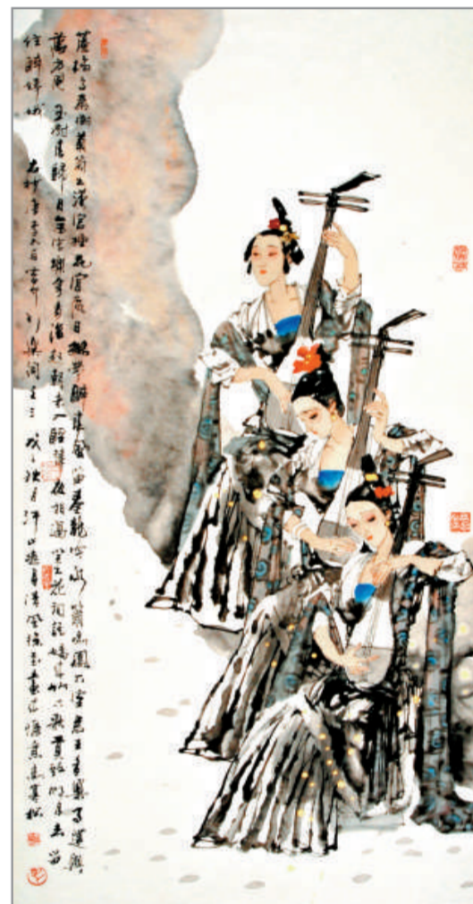
▲宮中行樂圖 馬寒松