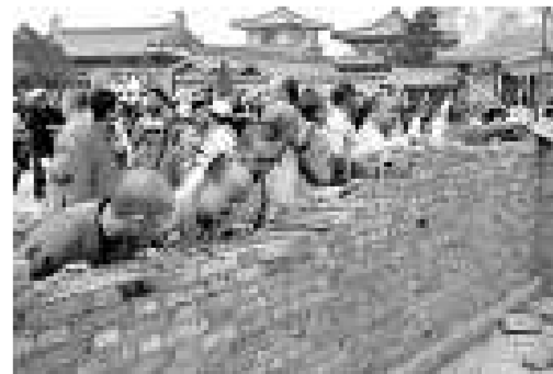
法門寺眾僧侶20日合力推倒在院前搭建的圍牆

重新規劃的法門寺文化景區佔地9平方公里，總投資15.7億元，自2007年4月起開工建