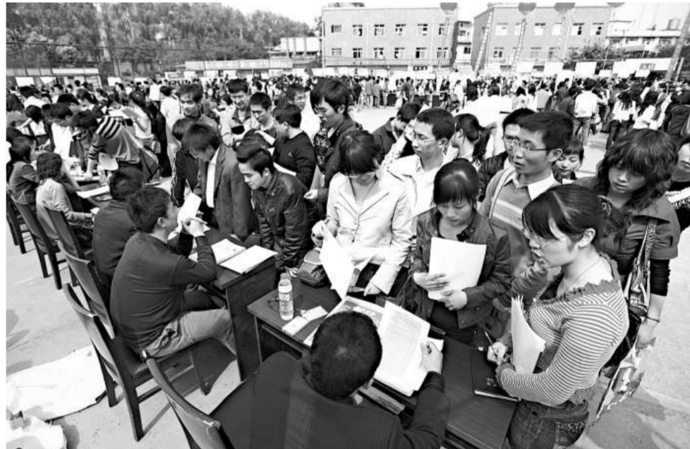
「春暖09，成就夢想」大學生就業創業招聘會22日在四川師範大學舉行

據介紹，已實現就業的群眾，多是通過廢墟清理、衛生防疫等公益性崗位安置，而隨着災後恢復重建工作的推進，這些公益性崗位將逐漸減少，部分群眾又將面臨失去工作崗位的情況。因此，仍需繼續實施就業援助。