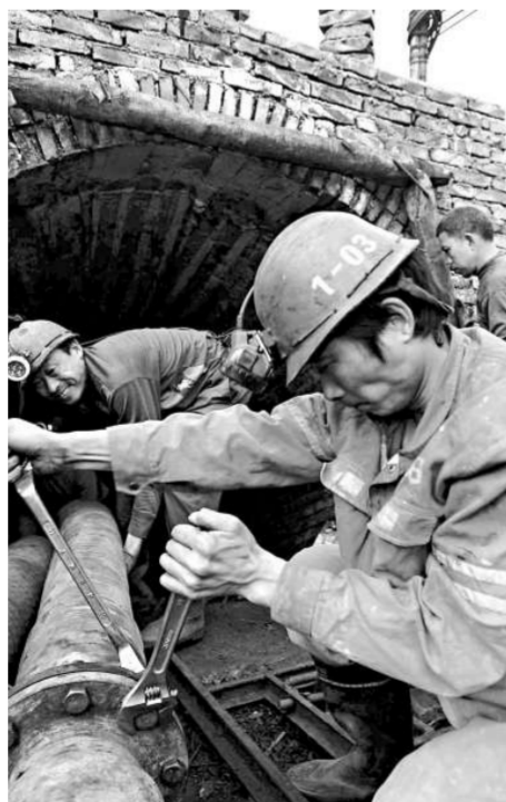
救援隊24小時輪班抽出礦下積水 (新華社)

當地一位村民表示，三角塘鎮原來有許多小煤礦，地下採空層比比皆是，極易發生透水事故；而事故發生的礦井又是一個「獨眼井」，存在很大的安全隱患，也增加了救援難度。