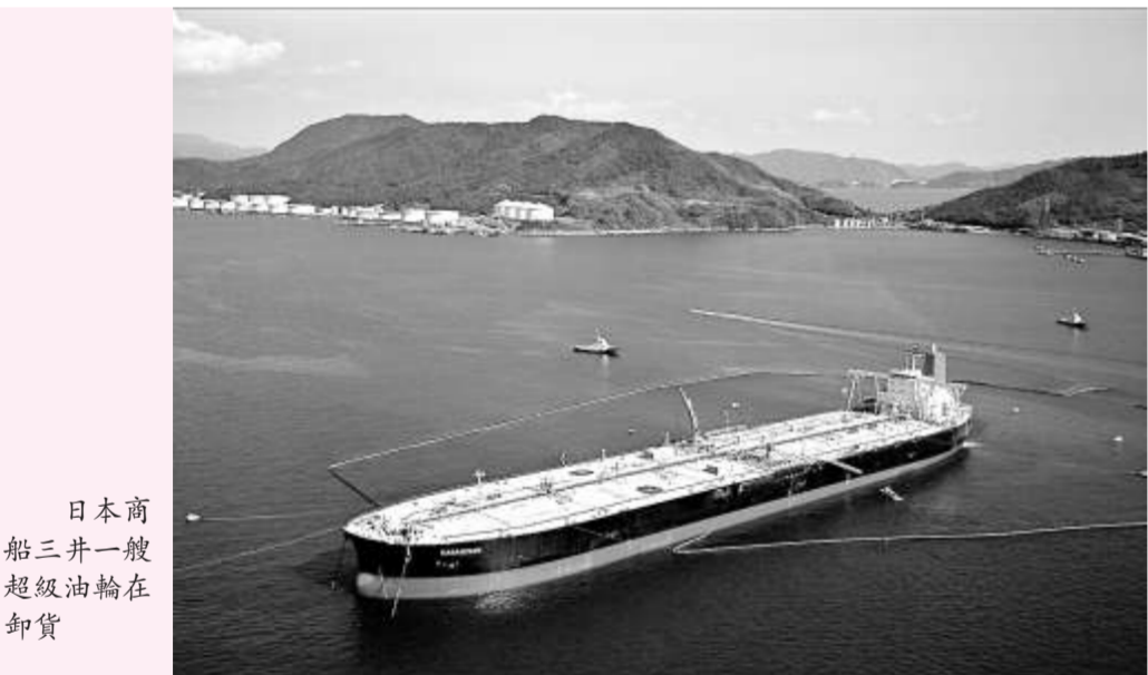
日本商船三井一艘超級油輪在卸貨

【本報訊】超大型油輪（VLCC）地中海航線日租金上周跌至5年低位，拖累蘇伊士油輪和船型租金同時受壓，船東經紀普遍預期油輪租金本周仍會持續下跌。現貨租金低企，影響船東制訂長期合約意欲，現時大部分合約期限只有1年或2年。 希臘油輪公司 Tsakos Energy Navigation 首席執行官沙拉古路表示，現時只有政府機關和大型油公司仍願意租用油輪，船東和租家仍未認清