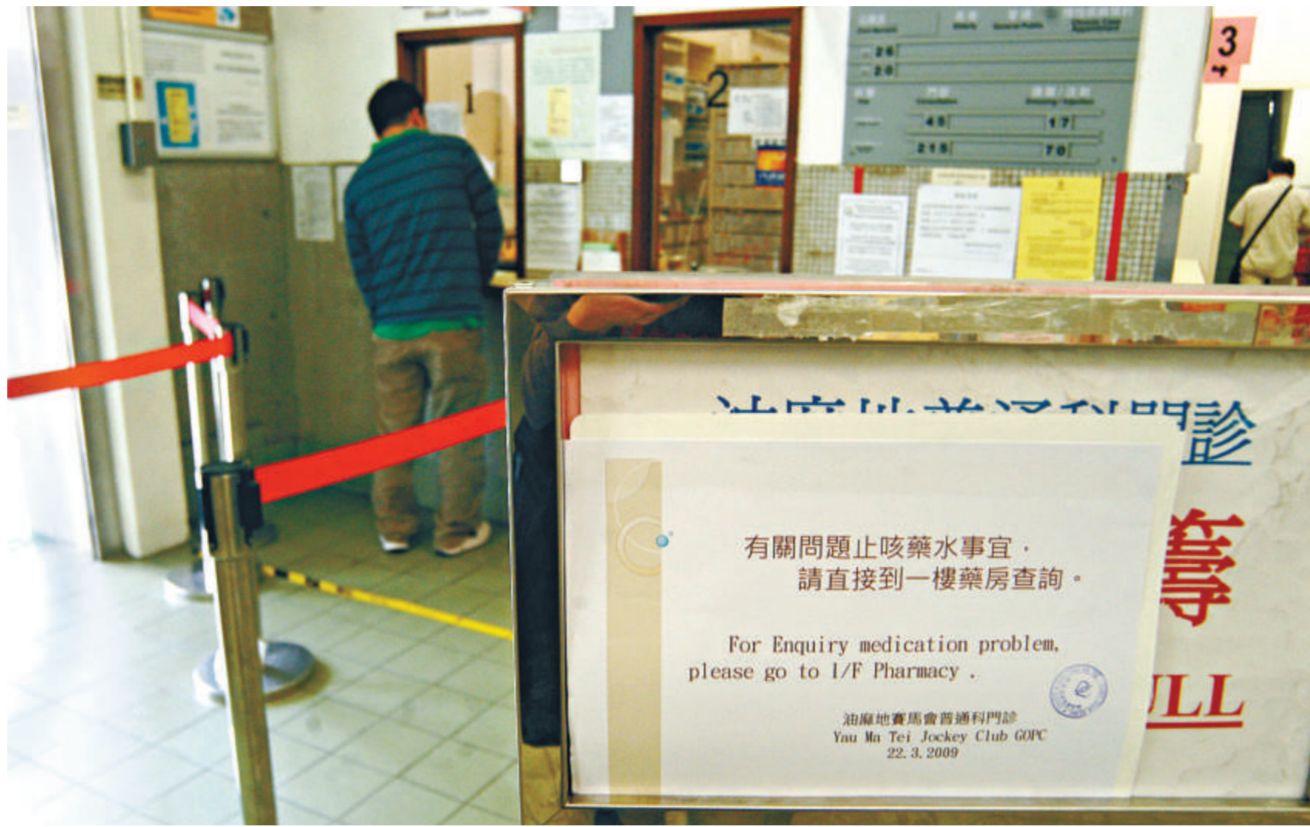
藥物事故連環爆發令市民對藥物監管機制大失信心

而藥物監管制度檢討委員會轄下由衛生署署長林秉恩率領的專責小組，昨日舉行首次會議，會上確定了工作時間及優先工作範圍，包括確立及評估製藥過程中出現的微生物危害，並就監察模式作出建議。另外，海外專家將會審視香港的GMP制度和藥物監管，以作出改善。