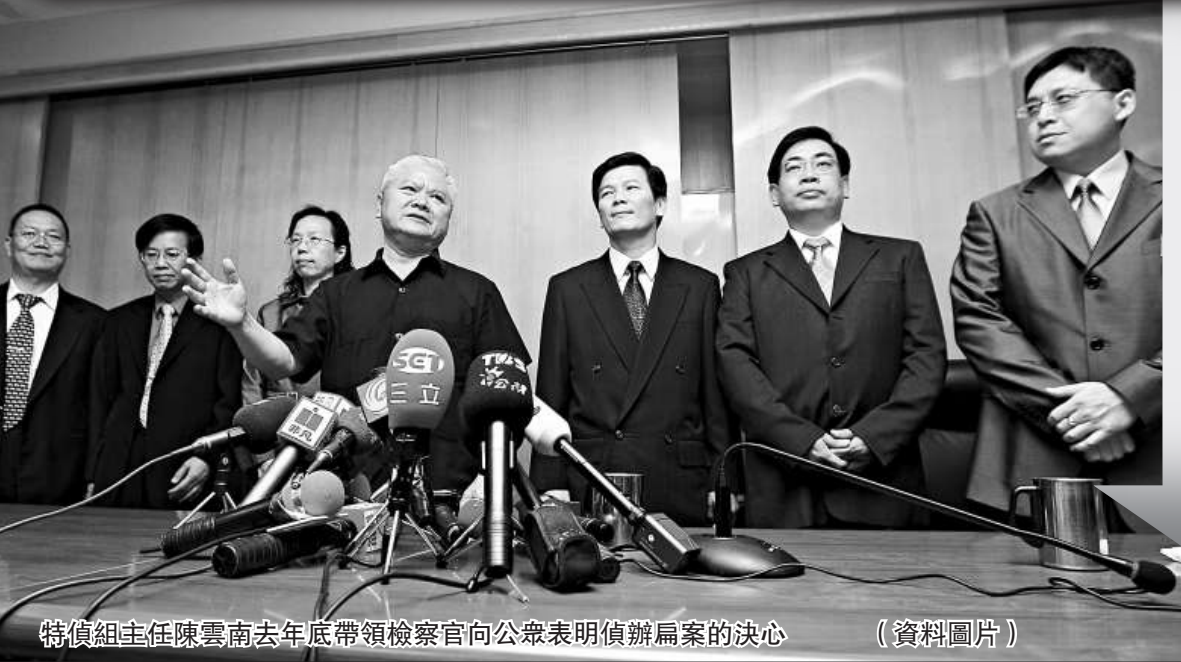
特偵組主任陳雲南去年底帶領檢察官向公眾表明偵辦扁案的決心