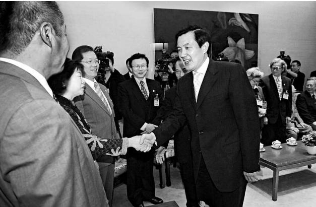
由於政績沒有起色，民眾對馬團隊的信任指數持續下降。圖為馬英九於二十四日出席活動

此外，各項數據也顯示，民進黨信任指數略升0.6點達33.5，黨主席蔡英文信任指數微降0.2點達41.7，戴立安研判，陳水扁及其家人涉及多項貪污與洗錢弊案已密集進入司法程序，甚至透過各種方式進行訴訟攻防，但調查結果趨勢顯示，這項做法已喪失其邊際效益以及民眾的關注程度，對民進黨影響有限。民進黨支持者信任與不信任蔡英文的比例，則仍維持在二比一。