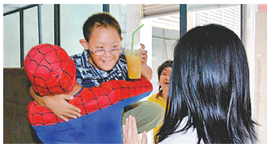
泰國一名消防員二十三日打扮成蜘蛛俠，哄誘一名危坐窗台的八歲男童返回地面

【本報訊】據法新社曼谷二十四日消息：泰國一名消防員二十三日打扮成蜘蛛俠，哄誘一名危坐窗台的八歲男童返回地面。