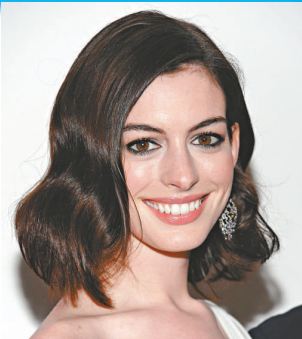
▲安妮人靚演技好，機會不絕

Geri與佳烈治回復單身後，各自傳出不少緋聞，感情生活十分多姿多采。從這個角度來看，二人十分匹配哩。