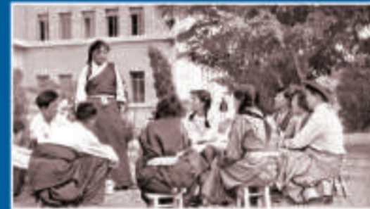
▲學員們交流學習體會