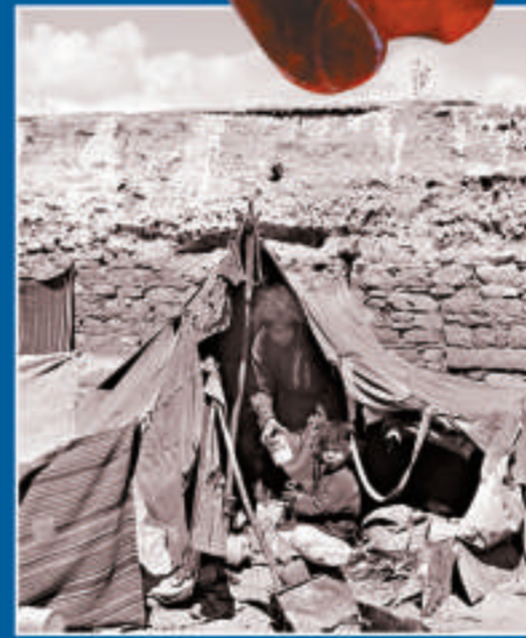
▲舊西藏，生活窘迫的農奴們根本沒有學習的機會