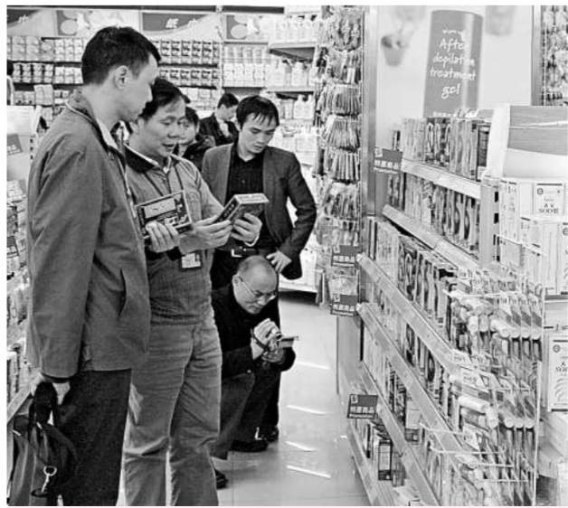
食品藥品監督局人員加強對染黑類化妝品檢查

廣東省食品藥品監督管理局有關工作人員表示，染髮類化妝品屬於九大類特殊用途化妝品之一，必須取得國家有關部門批准才能使用，生產中不得添加間苯二胺。對於違法生產的企業，廣東將依法立案查處。工作人員還透露，食品藥品監督部門在日常監管中，對企業的投料和生產記錄等進行監管，一旦發現問題將依法嚴肅查處。