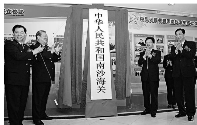
廣州南海海關正式掛牌開關