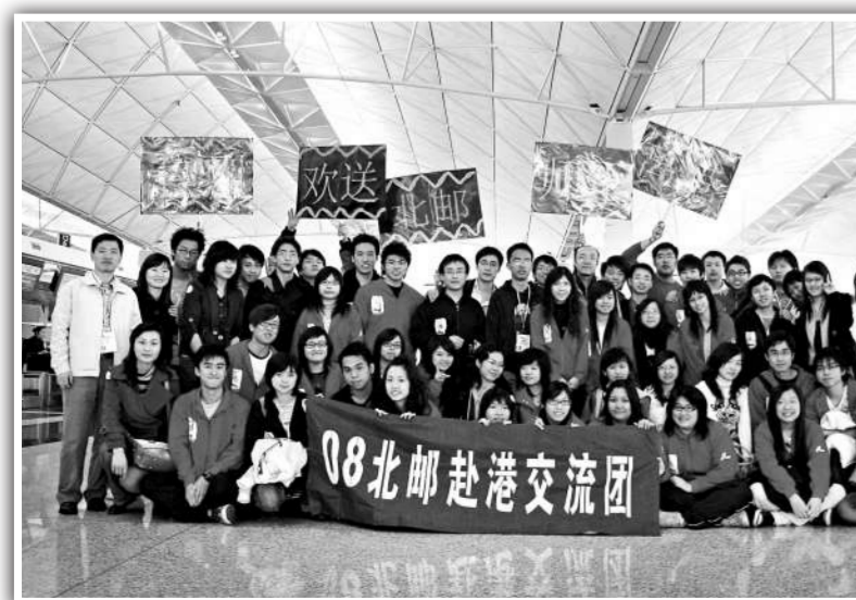
▲港專同學與來港交流考察的北京郵電大學學生在機場依依話別

不長不短的頭髮，很大很圓的眼鏡，總是向我微笑的臉。她就是我的外婆。 外婆以前是一個小學老師，但早已退休了。她比我還矮一點，臉上已佈滿了很多皺紋；她頭上那片白色頭髮就像一頂帽子；她走路時，看起來有點慢，但還是很有精神的。她還開始學畫畫，她的作品很不錯哩！ 「你在學校裡情況好不好？」「上一次考試怎樣？」每次見面，她都關心我讀書的情況