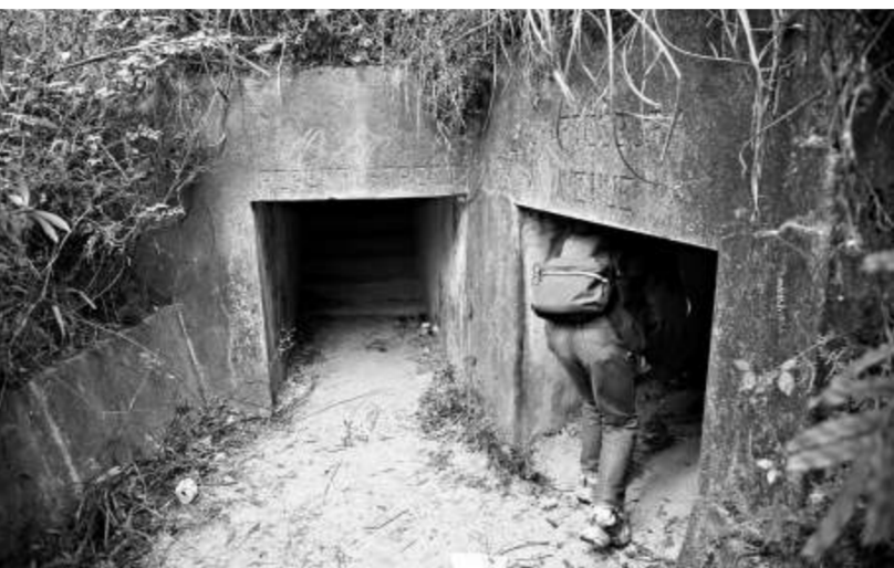
金山郊野公園的城門砲堡被列為二級歷史建築