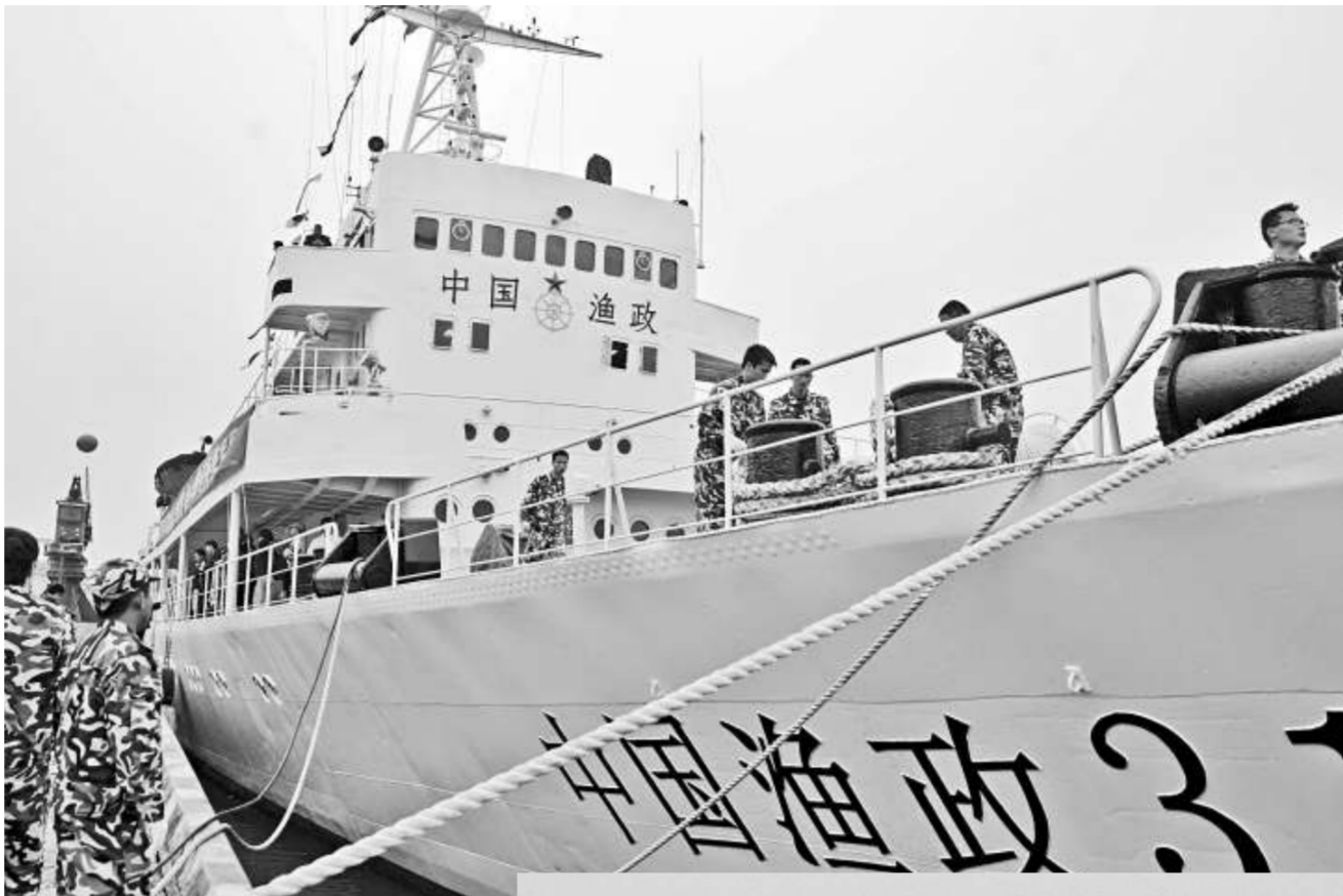
▲ 中國最大、設備最先進的漁政船「中國漁政311船」近日正式投入使用

面對新老海疆危機，中國面臨艱難選擇，最關鍵的是確立清晰明確、剛健有爲的大海疆戰略。這個大海疆戰略至少應包括如下幾點：一是應通過諸如《中國海疆法》之類的國內立法，賦予維護行動以合法性，包括軍事在內各種宣示和維護主權的措施必不可少；二是針對海疆嚴重受到侵犯的特殊局面，有必要籌建「中國海疆局」，作爲協調與整合國土資源部、國家海洋局、外交部、公安部、國防部、海軍等部門的治理海疆的專職國家機構；三是兩岸戮力保衛中華海疆。「兄弟鬩牆，外禦其侮」，大陸和台灣無論怎麼鬥，在捍衛中華海疆主權上都應該是一致的。更何況兩岸正從昔日的「關於牆」走向文化、經濟、政治等層面的交流與合