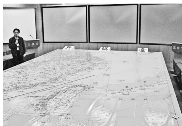
2006年台灣軍方首度公開漢光演習電腦兵棋推演的相關場地以及兵棋台 (資料圖片)

尤其在「國防」、「外交」、兩岸三大領域作爲，更看出差異性。輿論指出，以負責任態度處理大政，以更宏觀角度衡量評估潛在的危機，強化各種緊急應變能力，這才是執政者應有的健康心態。