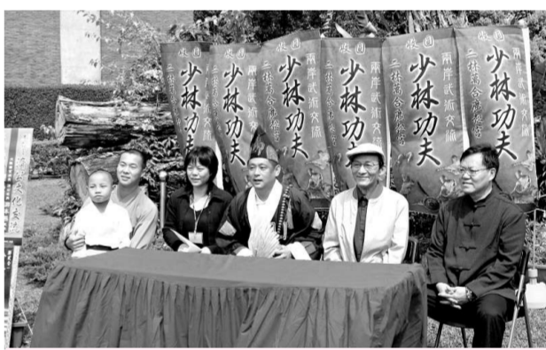
游本昌(右二)二十年前曾經受邀來台，但卻未能成行，此次終於了卻多年之心願

與北京元鴻少林功夫團一起來台進行交流的還有大陸著名的「濟公」扮演者游本昌。二十年前他曾經受邀來台，但卻未能成行，此次來台參加廣懿宮舉辦的濟公精神文化交流會，終於了卻他多年之心願。「希望大家一起廣結善緣、愛緣，兩岸攜手共同抵禦金融風暴、渡過難關。」