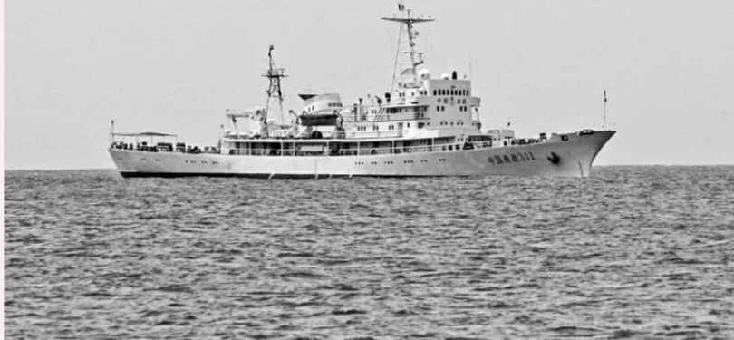
▶ 「中國漁政311船」3月17日抵達西沙永興島，在南海海域履行宣示國家海洋主權和捍衛漁業、漁民權益的任務

作，所以開啓包括軍事合作在內的兩岸共同捍衛中華海疆主權的合作機制，也是可能的。特別是，台灣是第一島鏈的中心點，北瞰釣魚島，南俯南海並在南沙最大島嶼太平島有駐軍，所以兩岸戮力合作對保衛中華海疆具有不可替代和無法估量的戰略價值。