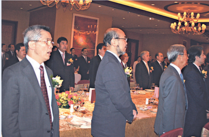
▲全體起立唱國歌

示聽了市長的介紹之後，感到「令人陶醉，令人振奮，令人嚮往」。對惠州近年在市委、市政府正確的領導下，經濟發展、社會進步等方面取得可喜的成績表示了高度的讚賞。並一致認同粵港澳應加強交流合作，樹立信心，同心協力面對挑戰，共謀雙贏，共創美好的明天。