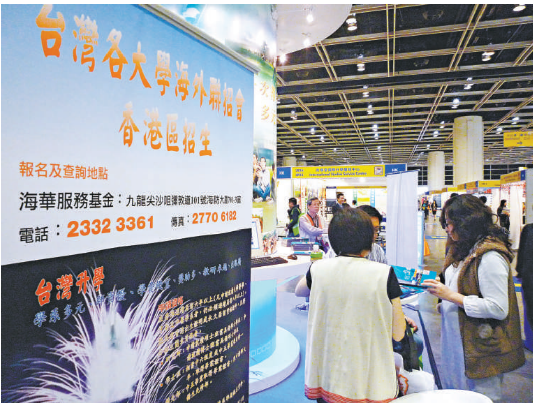
◀港台民間團體舉辦台灣升學講座日漸增多 (資料圖片)

對於「家校合作組」以公函支持學校參加台灣升學講座，教育局發言人僅稱是提供資訊平台；並說，本星期六下午五點至七點，沙田區家長教師會聯合會也舉辦同類講座，在家