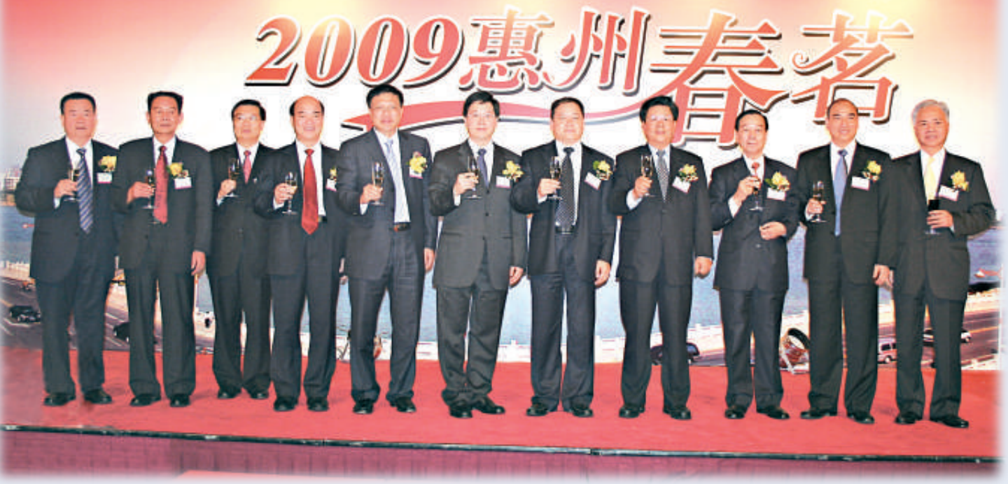
▲主禮嘉賓祝酒 (本報攝)