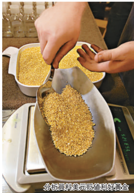
分析員料美元貶值利好黃金

全球商品市場經歷去年動盪一年，今年似有回暖跡象，巴克萊資本研究報告指稱，今年首季金融機構管理的商品資產增加 200 億美元，在各類商品中，巴克萊看好銅價走勢。不過，美國上周石油庫存增加 330 萬桶，有分析員估計油價面臨下跌壓力。