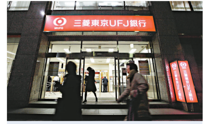
三菱 UFJ 是日本最大銀行，將會持有合營的日本證券公司六成股權，餘下由大摩持有

有 116 個分行，職員逾 6500 人，截至 12 月 31 日止季度，該部門營業額 850 億日圓。