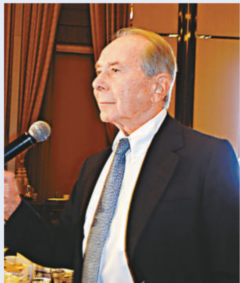
格林伯格認為 AIG 考慮申請破產保護令

AIG 員工向路透社透露，倫敦辦公室的大部分員工認為，要求退還花紅的要求充滿敵意。無論這是否構成犯罪，其實實無異於恐嚇，而且也沒有任何道德上的理由。