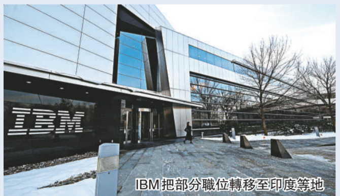
IBM 把部分職位轉移至印度等地

去年 11 月以來，美國企業削減逾 82.3 萬個位，上月失業率攀升至 8.1%，是四一世紀來最高位。IBM 其他部門人手不斷流失，包括軟件及銷售部。在 2007 年 IBM 裁員逾 2000 人。分析員表示，IBM 裁員行動未結束，IBM 員工流失率創紀錄。IBM 股價一度跌 35 美仙至每股 97.95 美元。據《華爾街日報》報道，IBM 把部分工廠轉移至印度，由 2007 年始，IBM 在巴西、俄羅斯、印度及中國增聘員工。同業對手，全球最大軟件製造商微軟於 1 月宣布史無前例裁員行動，準備裁減 5000 名員工。英特爾計劃關五家廠房，受影響員工達 6000 人。