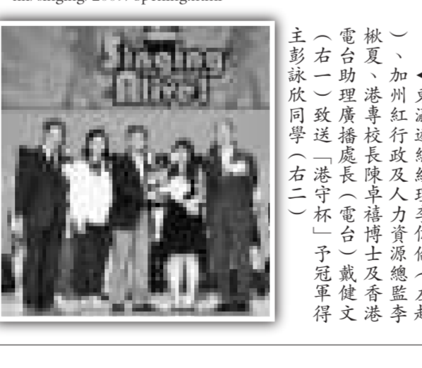
▲主禮嘉賓康陳翠華為學生授憑及頒獎

擔任主禮嘉賓的教育局首席教育主任(專業發展及培訓)康陳翠華與師生們分享人生體會時表示，她見過不少學歷高、財富多的人士生活上卻並不快樂，許多甚至在一夜間身敗名裂，失去地位、名譽。她寄語同學，與其極力追求身外財富、地位等物，不如做好自己，讓自己活得更美好。她說，要達成這個目標，首先要有感恩的心，要對父母、師長、社會常存感恩之心；其次要善用本身才能，努力貢獻社會；第三是要有堅毅、忠誠的心，忠於所做的工作、事業。而教育的偉大成果，正在於改進個人的能力和改變個性、氣質，令人們踏上成功之路，得以改變一生。