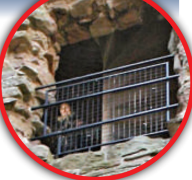
▲靈異照亞軍：無人開篷車的倒後鏡內出現人面