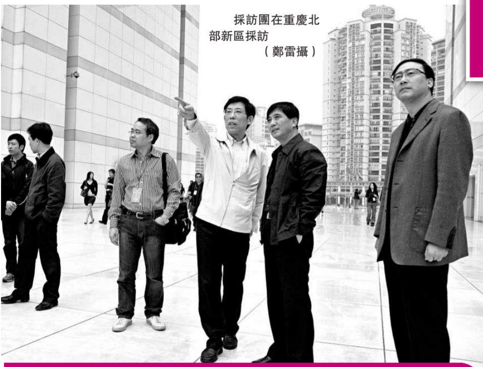
採訪團在重慶北部新區採訪