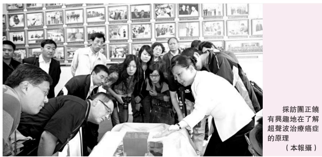
採訪團正饒有興趣地在了解超聲波治療的原理

MDA認證、歐盟CE認證、韓國KFDA認證。截至2009年2月，該技術已獲得國際發明專利22項（共7個國家，國家專利36項）；海扶系列設備已分別出口英國、日本、韓國、馬來西亞、俄羅斯、西班牙、意大利等國家和地區，全球治療各類惡性腫瘤患者近4萬例，目前香港瑪麗醫院就擁有這麼一台神奇設備在為病人服務。