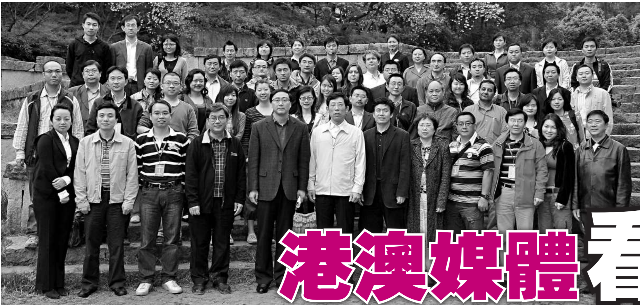
◀重慶市委宣傳部副部長、外宣辦主任周波（前排左五）、國務院新聞辦李延風副局長（前排左八）與採訪團團長、香港大公報社長姜在忠（前排左六）及團員合影留念

重慶市目前正在全力打造「森林重慶」、「暢通重慶」、「平安重慶」、「健康重慶」和「宜居重慶」——「五個重慶」。今日下午，港澳媒體赴渝採訪團結束一周的訪問，在重慶一周的緊湊行程中，採訪團也清晰地感受到了「五個重慶」：「開放重慶」、「自信重慶」、「山水重慶」、「美食重慶」和「潛力重慶」。