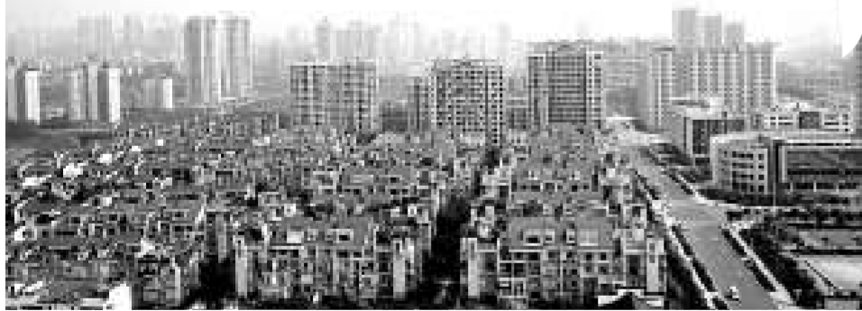
重慶北部新區（資料圖片）

目前，北部新區已成為中國中西部面積最大、工業產值和財政收入最多的開發新區。國務院3號文件明確要求把重慶北部新區建設成為中國內陸開放型經濟先導區，形成高新技術產業研發、製造及現代服務業聚集區。