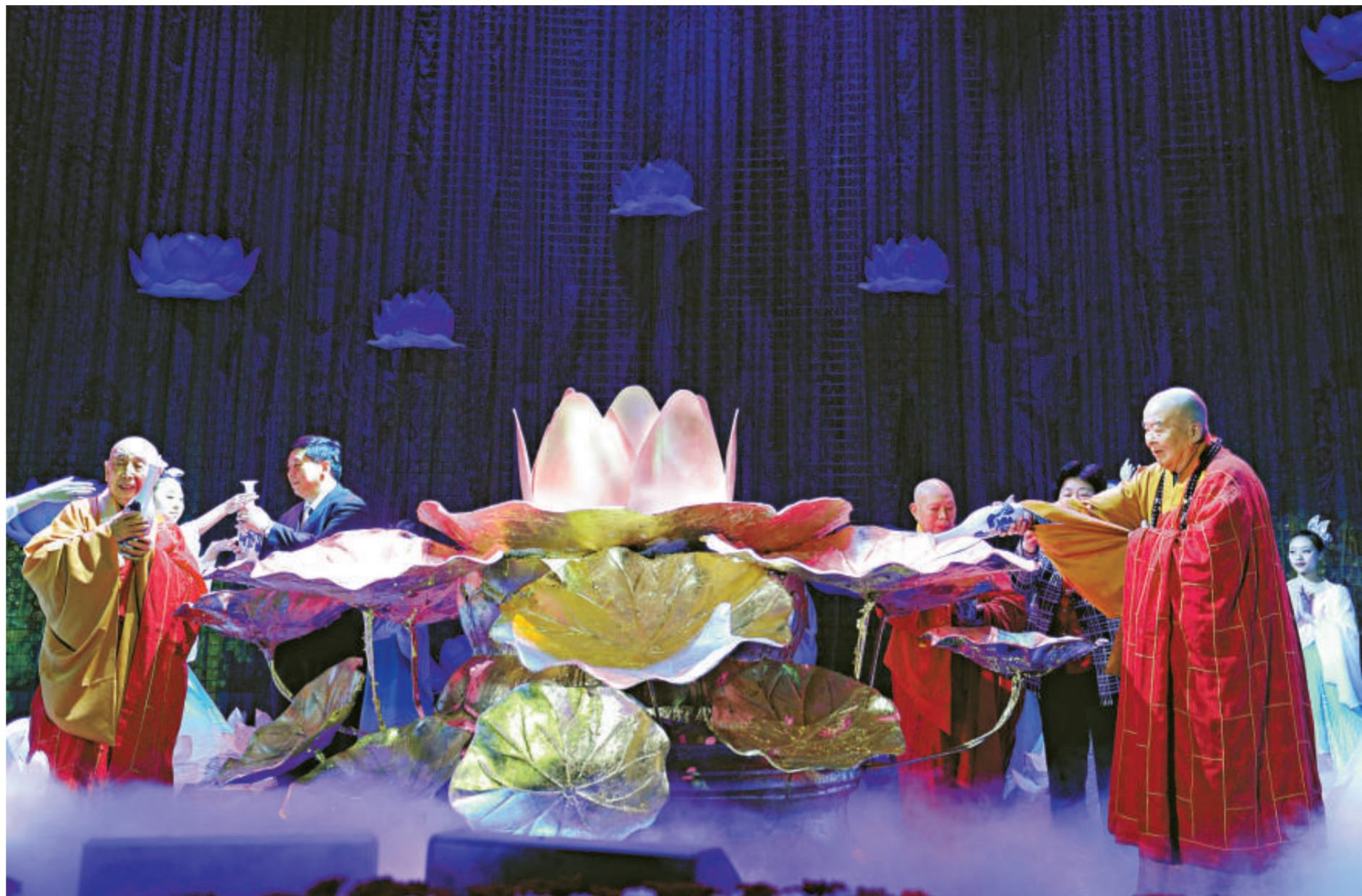
世界佛教論壇二十八日在江蘇無錫開幕，中國佛教協會會長一誠長老（後）、來自台灣的國際佛光會世界總會會長星雲長老（右）、香港佛教聯合會會長覺光長老，身披紅色袈裟受邀共同為論壇拈香祈福。

當前對朝鮮民族來說，國家的分裂已成為最大的「苦」，只有實現祖國統一才能從這「分裂之苦」中擺脫出來。「所以我國佛教徒與全體同胞一起把祖國統一事業視為最重要的任務，並為實現祖國統一進行着積極的活動。反對戰爭、保衛和平是實現朝鮮半島的統一和維護亞洲和世界和平的保證，也是堅持佛教的和平理念的道路。」