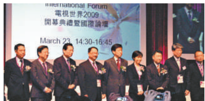
▲影視展的「電視世界」日前揭幕

革新以後的亞視將推出香港製作的高清節目時段，是由最初每周播二十四點五小時增至三十八點五小時，而所播的兩條標準頻道包括：中央電視台中文國際頻道與台灣的中天亞洲頻道，並擬於七月份推出本港節目爲依據的第三條標準電視頻道。