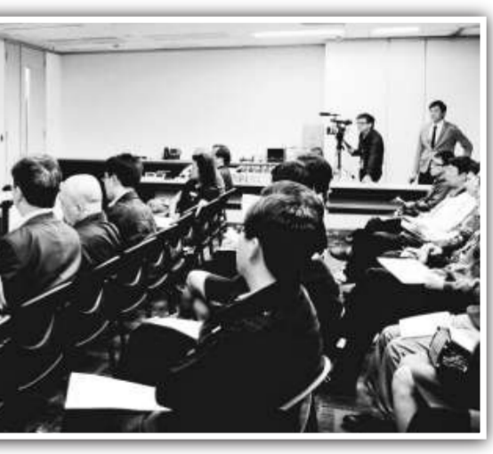
▲應科院與專門開發教育軟件平台的MyIT-School合辦電子學習研討會，介紹點對點技術在互動和協作學習上的應用

是次研討會受到學界關注，與會者積極發表意見，對於在移動設備上使用點對點技術以推動互動和協作學習這新意念反應尤其熱烈，應科院收集了很多正面意見，有助進一步改良該技術於電子學習的應用，為教育作出貢獻。（香港應用科技研究院供稿）