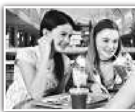
（英）的國子研究顯示嗜吃甜食的孩子成長速度加快

科技日報引述英國《每日郵報》的報道說，許多家長都對「嗜甜如命」的孩子束手無策，美國科學家的一項研究卻表示，喜愛甜食和含糖飲料的青少年的成長率較高，相關報告發表在美國《生理學與行為》雜誌上。