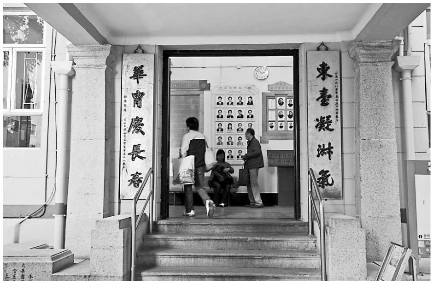
上環東華醫院主樓前門保留了初建時的樣貌

一書提到，東華、廣華和東華東院在一九三二年合併為東華三院後，作為龍頭的東華醫院地位受到新興力量挑戰，領導層不得不回應各方訴求，走向現代化，並決定斥資二十一萬元改建主樓，增至六層，工程於一九三四年完成。不過，主樓的大堂和前門仍是一八七二年的模樣，前門下側可見同治九年（一八七〇年）三月（西曆四月九日）港督麥當奴所立的基石。