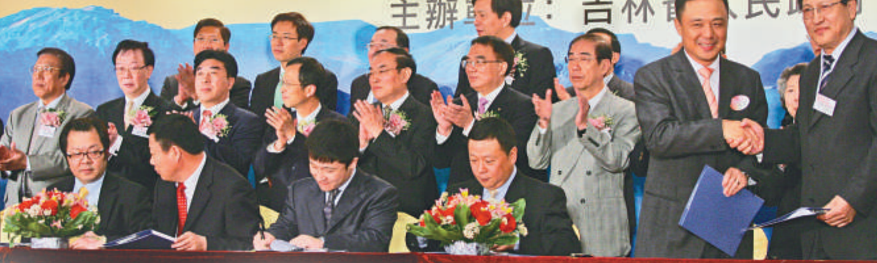
▲2009年吉港交流項目簽約儀式

「2009香港·吉林經貿交流合作周」昨日在香港展覽中心舉辦開幕儀式，吉林省經貿代表團在儀式上與香港企業共簽約36項目，加之今日即將簽訂的1項目合約，總投資額達592億元（人民幣，下同），引進外資567億元。