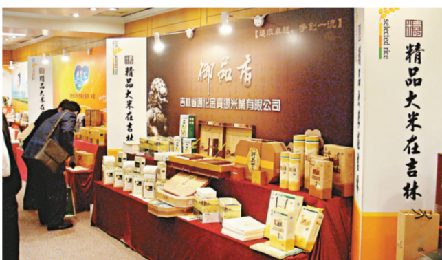
▲吉林省在港推介精品大米