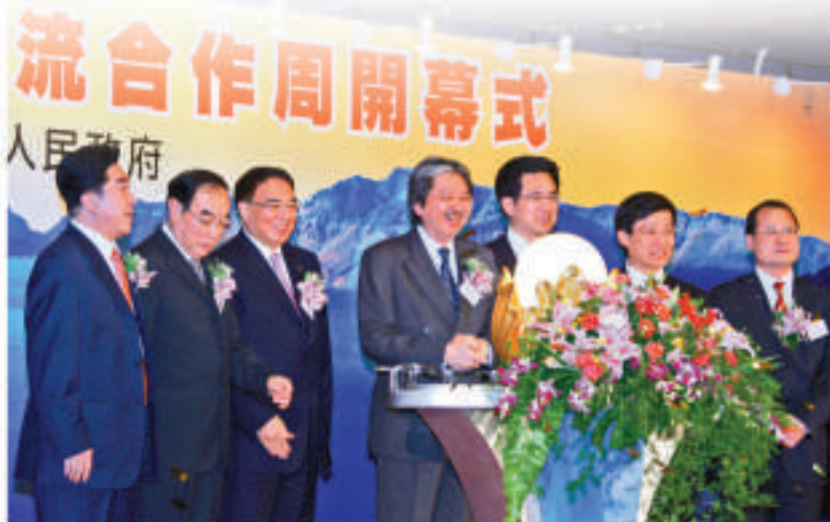
▲2009年吉港經貿交流合作周開幕式，由香港財政司司長曾俊華（中）參加開幕式

截止去年底，香港在吉林省累計投資達21.9億美元，在60個來吉林投資的國家和地區中居第1位。吉林省現有香港企業485家，投資領域主要涉及農副產品加工、食品加工、房地產業、製造業等。