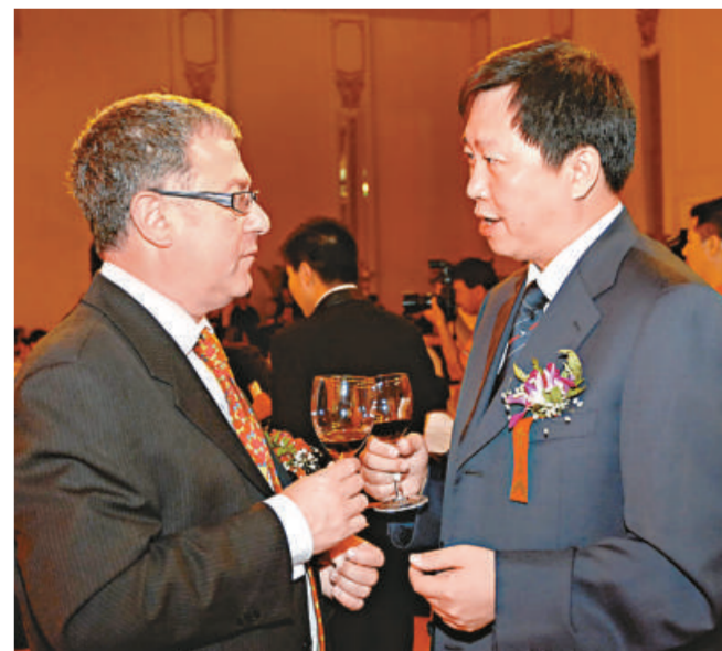
▲吉林省通化市委書記張安順（右）向客商推介葡萄酒

第三，通化產業富有特色，形成了醫藥、葡萄酒、鋼鐵三大支柱產業，湧現出東寶、修正、通鋼等名牌企業。通化東寶集團研製的人胰島素填補內地空白，使中國成為世界上第三個可以生產人胰島素的國家。