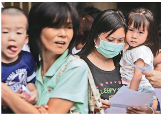
政府將為兩歲或以下兒童，免費注射「七價肺炎球菌結合疫苗」（資料圖片）如醫療輔助隊人員負責補種疫苗服務。衛生署正審慎有關計劃的細節，以確保所有的合資格兒童可接種疫苗。

為盡量減低對健康院現有服務的影響，政府計劃於辦公時間以外特別開放健康院，為合資格的兒童進行一次過補種疫苗。據悉，他們將會獲安排在星期日接種，政府正積極研究是否徵募人手協助，