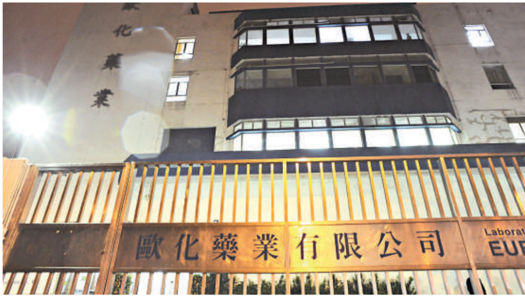
五宗藥物事故當中，只有歐化藥業涉及藥物質量問題（資料圖片）

另外，藥物監管制度檢討委員會將於本星期五進行首次會議，預期六至九個月內完成檢討。