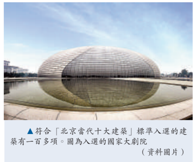
符合「北京當代十大建築」標準入選的建築有一百多項。圖爲入選的國家大劇院（資料圖片）

據活動組委會介紹，參評建築必須是在二〇〇〇年至二〇〇八年竣工投入使用的房屋建築工程。目前符合標準入選的建築有一百多項，其中包括國家體育場（「鳥巢」）、國家游泳中心（「水立方」）、國家大劇院、北京首都國際機場3號航站樓、北京奧林匹克公園（B區）奧運村、中華世紀壇等。