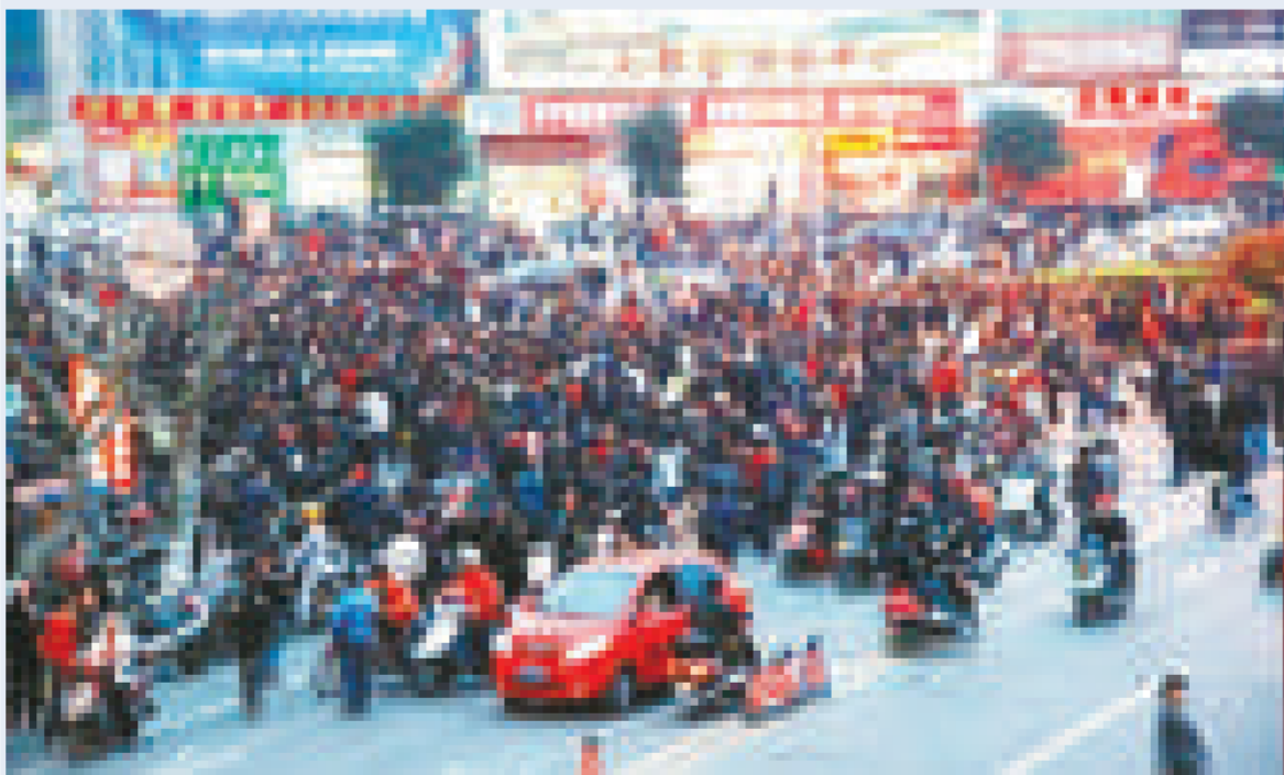
三月三十一日，四川南充數千市民聚集在市中心，致使交通要道交通中斷

【本報訊】人民網報道，3月31日下午，因不滿城管暴力執法，四川南充市數千市民集結於市中心進行抗議，致使最爲繁華的五星花園各交通要道交通中斷。